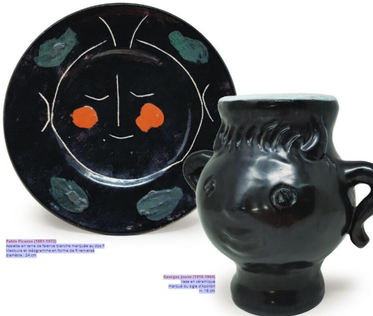
Pablo Picasso (1881-1973) Assiette en terre de faïence blanche marquée au dos F Madoura et idéogramme en forme de R renversé diamètre : 24 cm