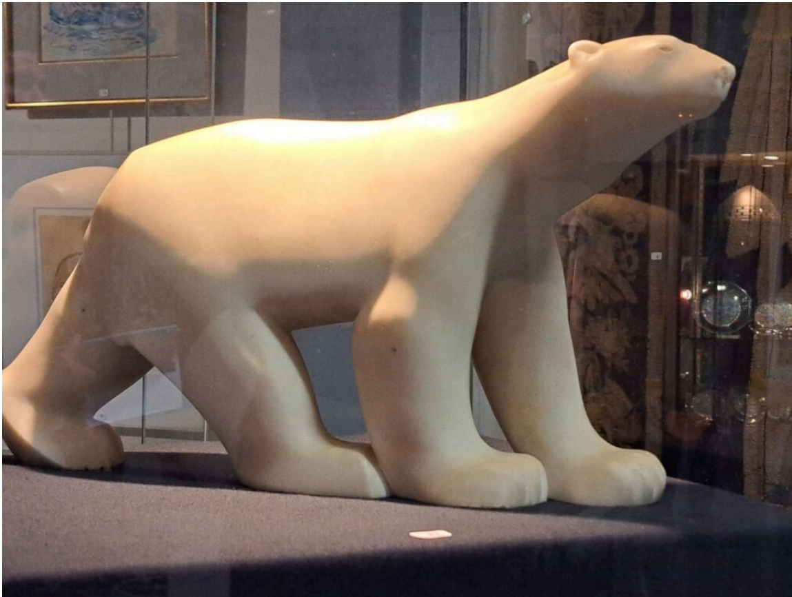
Ours Blanc de François Pompon