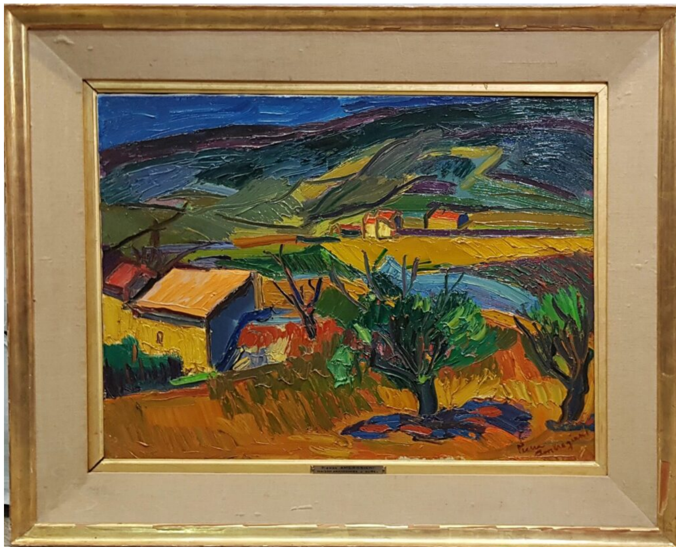
la maison abandonnée à Aurel

avec décor aux engobes dans les tons de gris, bleu, rouge, blanc sur fond noir - Marquée au dos F - Madoura et idéogramme en forme de R renversé - étiquette d'époque de la maison de cadeau à Montpellier. D : 24cm. A été acquise pour 4 400€.