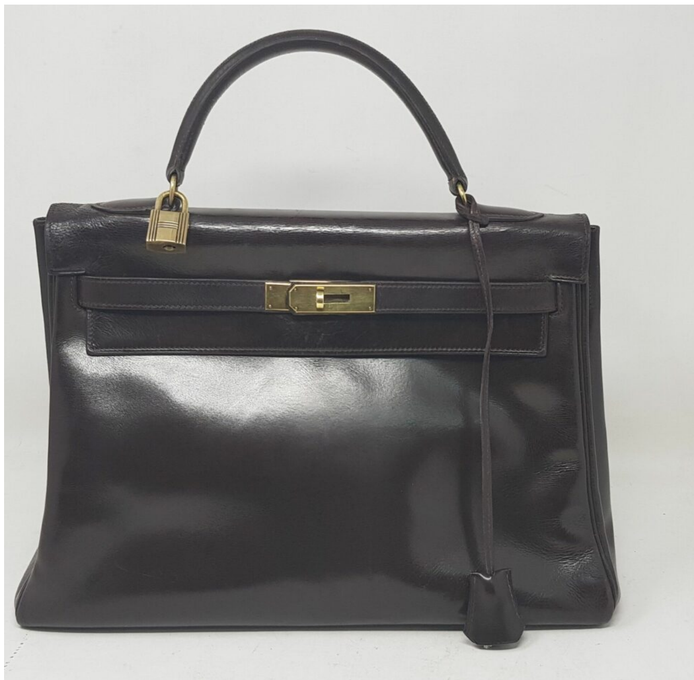
Le sac Kelly