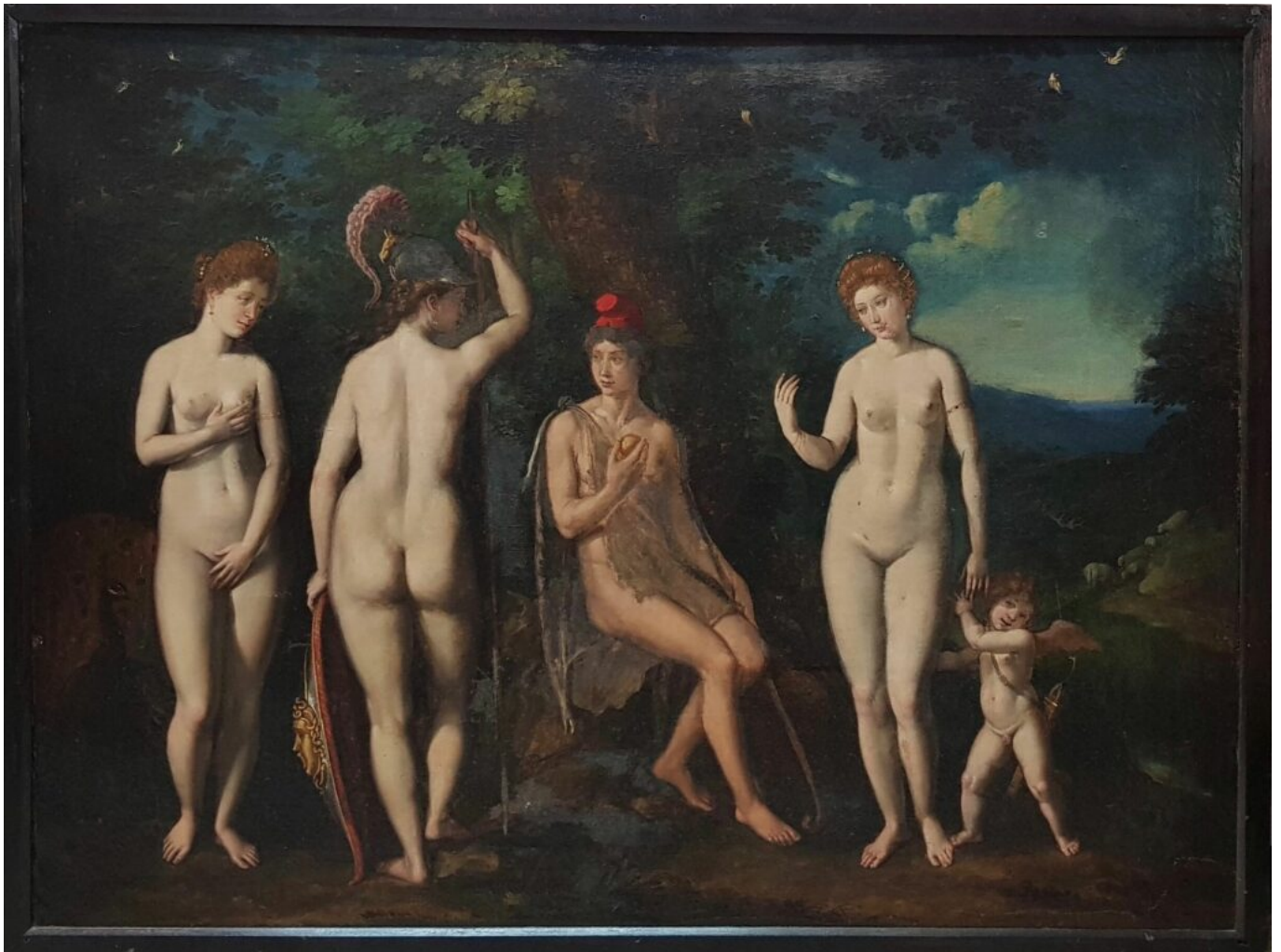
Le jugement de Pâris