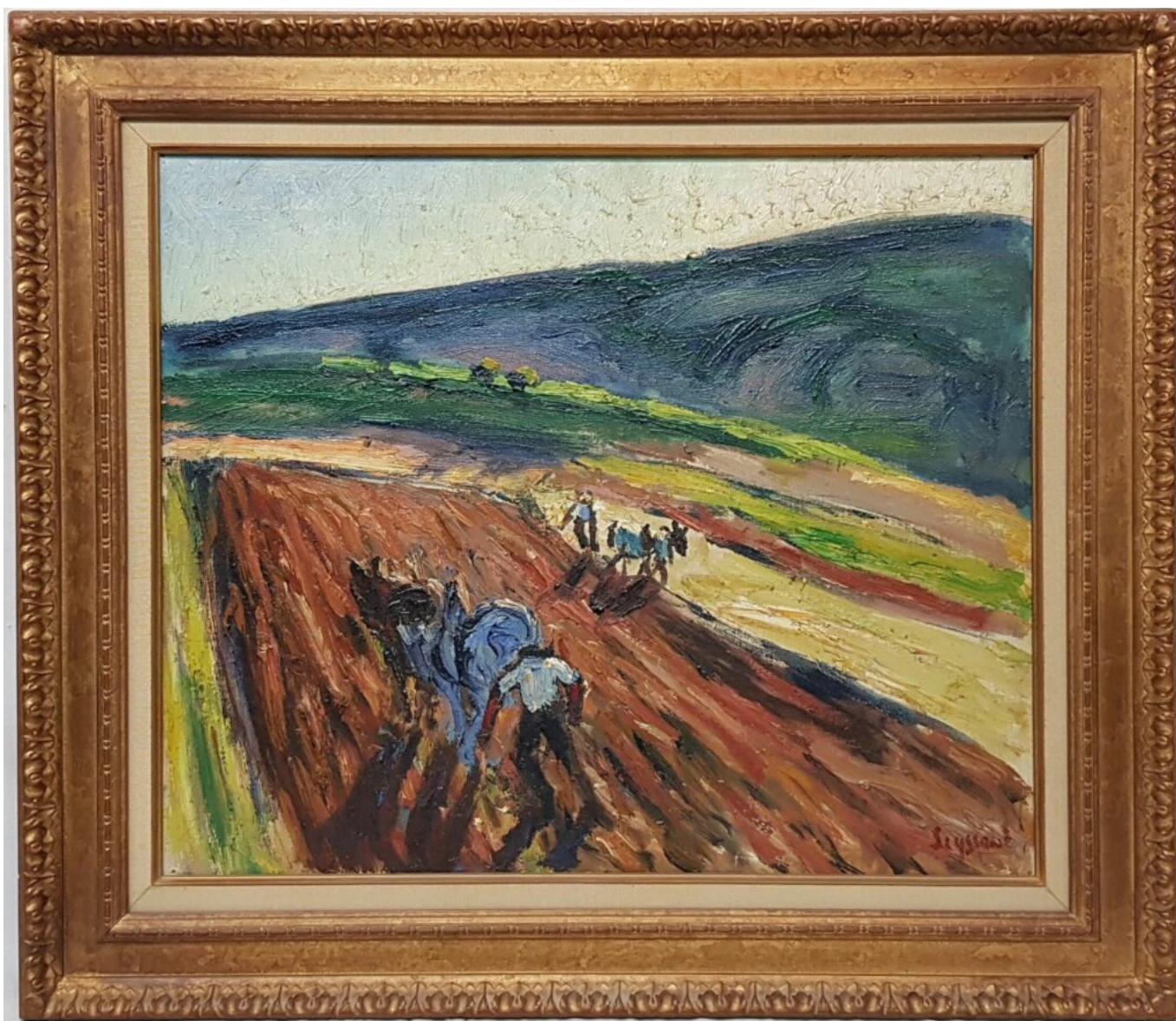
Labourage à Aurel

-Dim : 52x160mm à la base environ - Poids brut : 125g30 - Poids total des diamants : 4 carats environ, en très bon état a été adjugé à 5 600€.