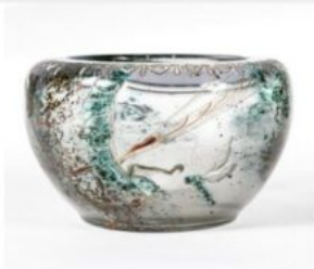
Emile GALLE (1846-1904) : * Les anisoptères * 1882. Rare et exceptionnelle coupe balustre évasée à large col annulaire rentrant. Epreuve en cristal soufflé au riche décor...