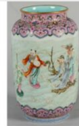
CHINE - XIXe siècle : Vase rouleau en porcelaine à décor émaillé