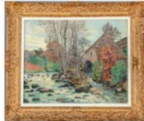
Armand GUILLAUMIN (1841-1927) : Moulin Charraut (dit Bouchardon). Huile sur toile signée en bas à droite, titrée sur le châssis et numérotée 21314. Dim. : 65.5x71 cm...