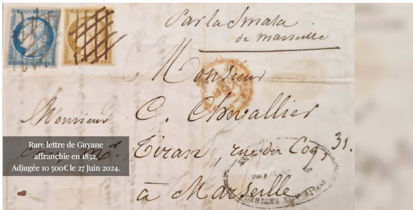
Rare lettre de Guyane affranchie en 1852. Adjugée 10 500€ le 27 Juin 2024.