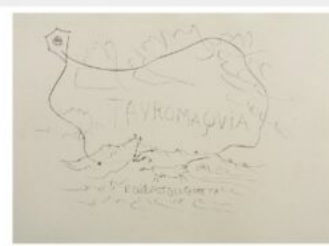
Pablo PICASSO (1881-1973): Jose DELGADO alias Pepe Illo - LA TAUROMAQUIA