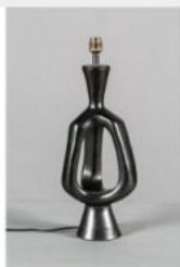
Georges JOUVE (1910-1964) : Rare et important pied de lampe de f