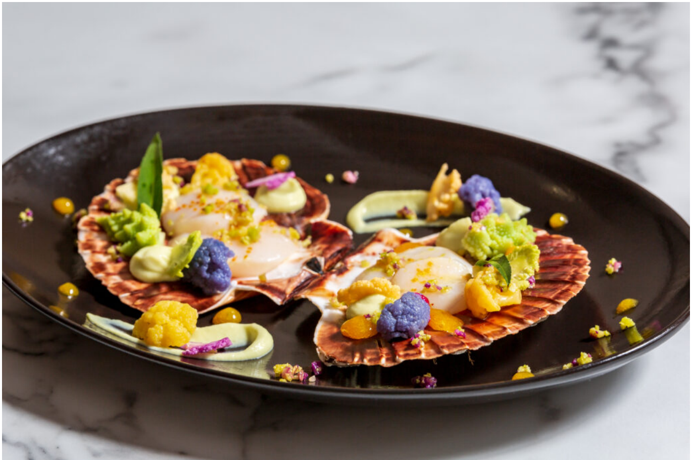
Coquilles Saint-Jacques