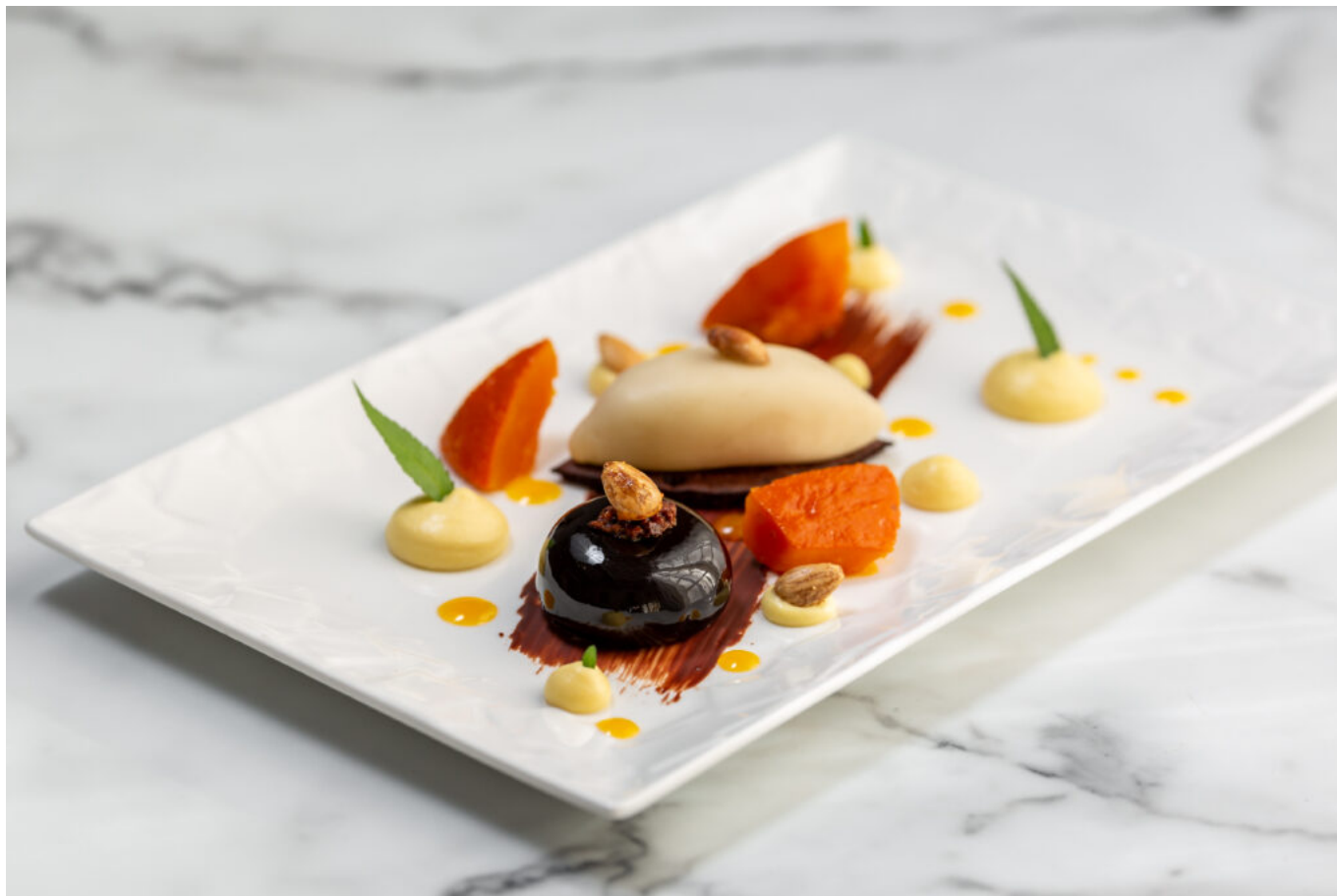
Dessert Restaurant