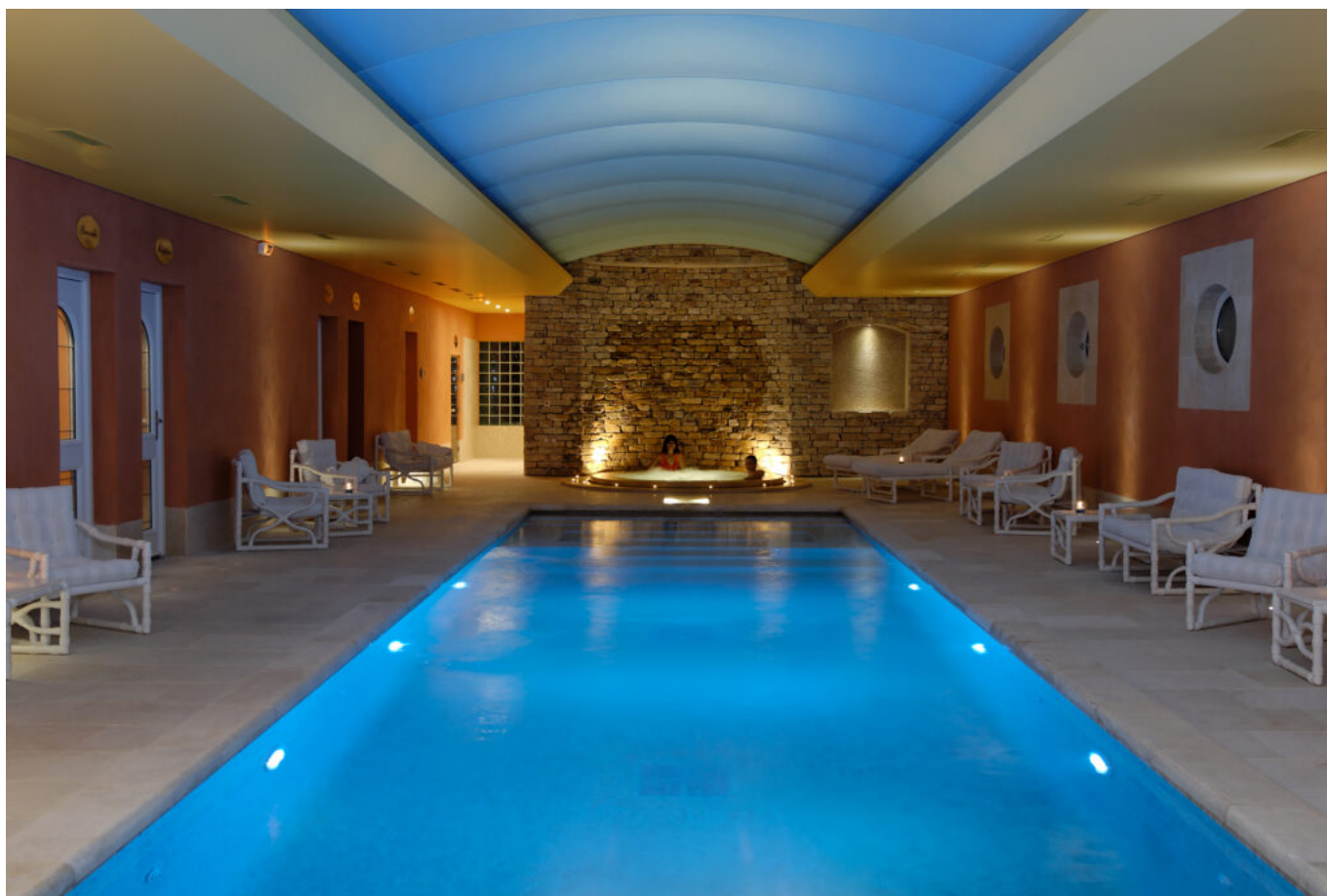
Piscine intérieure SPA