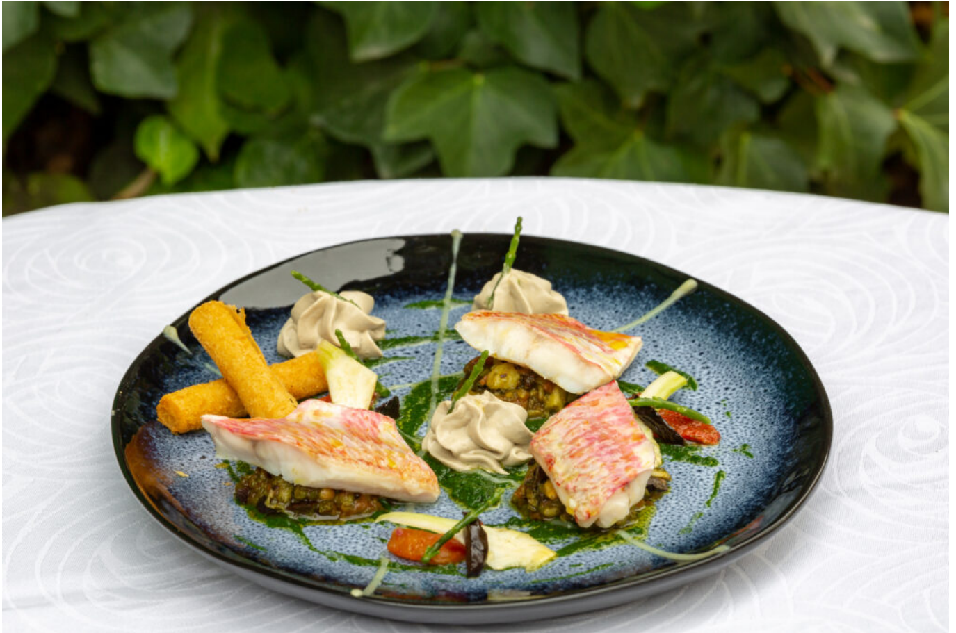
Rougets Restaurant