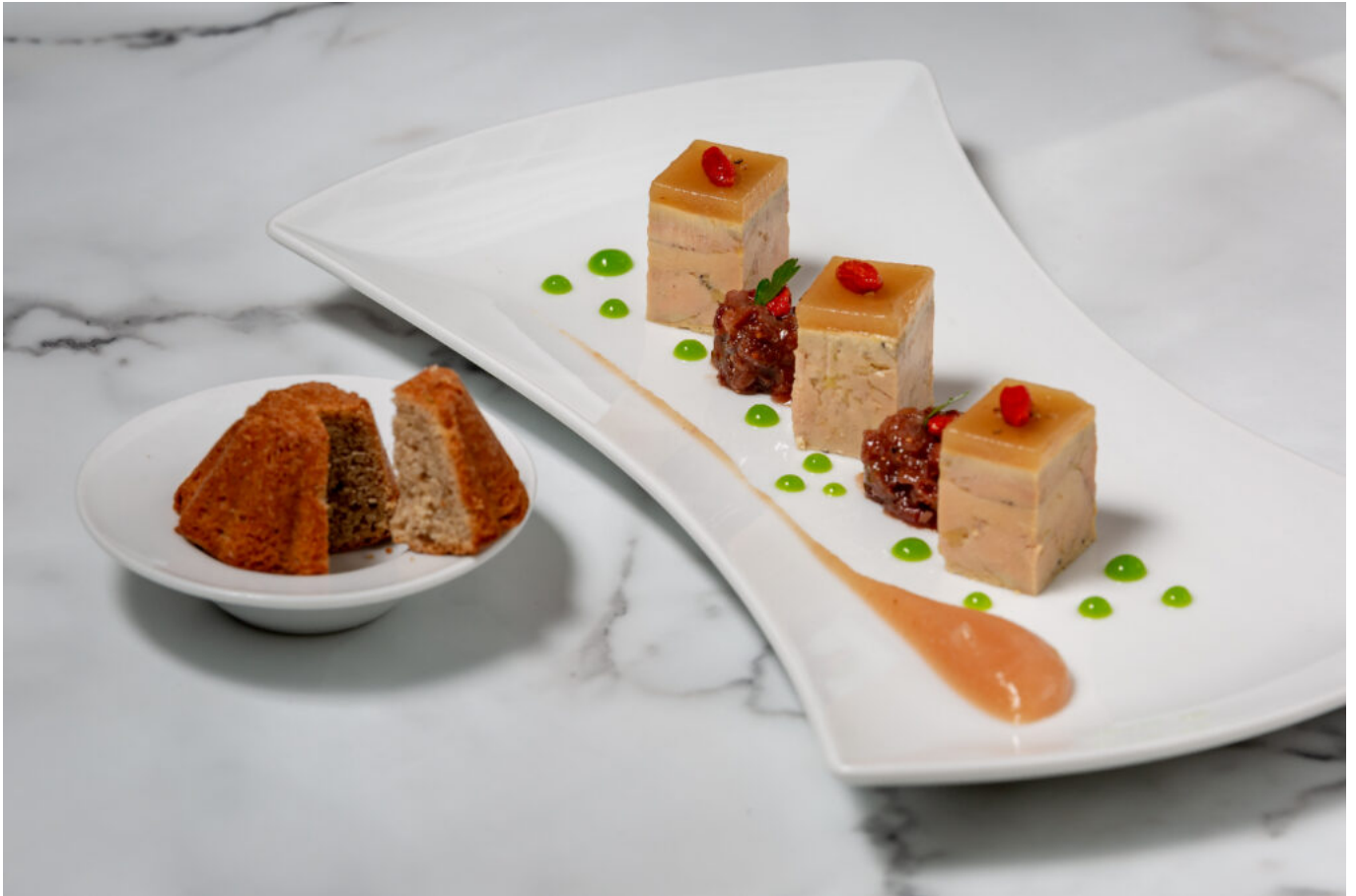
Foie Gras