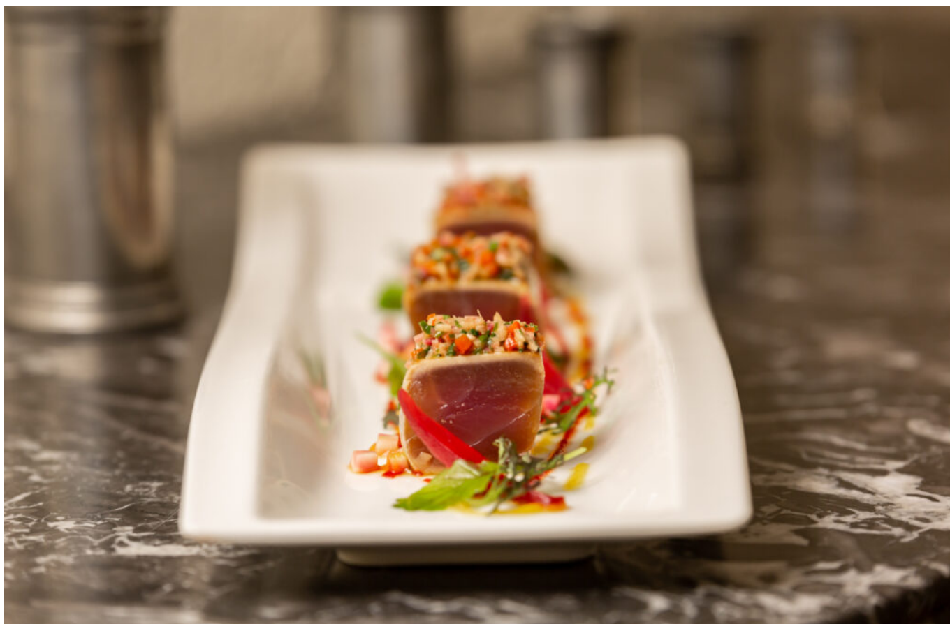
Thon Restaurant