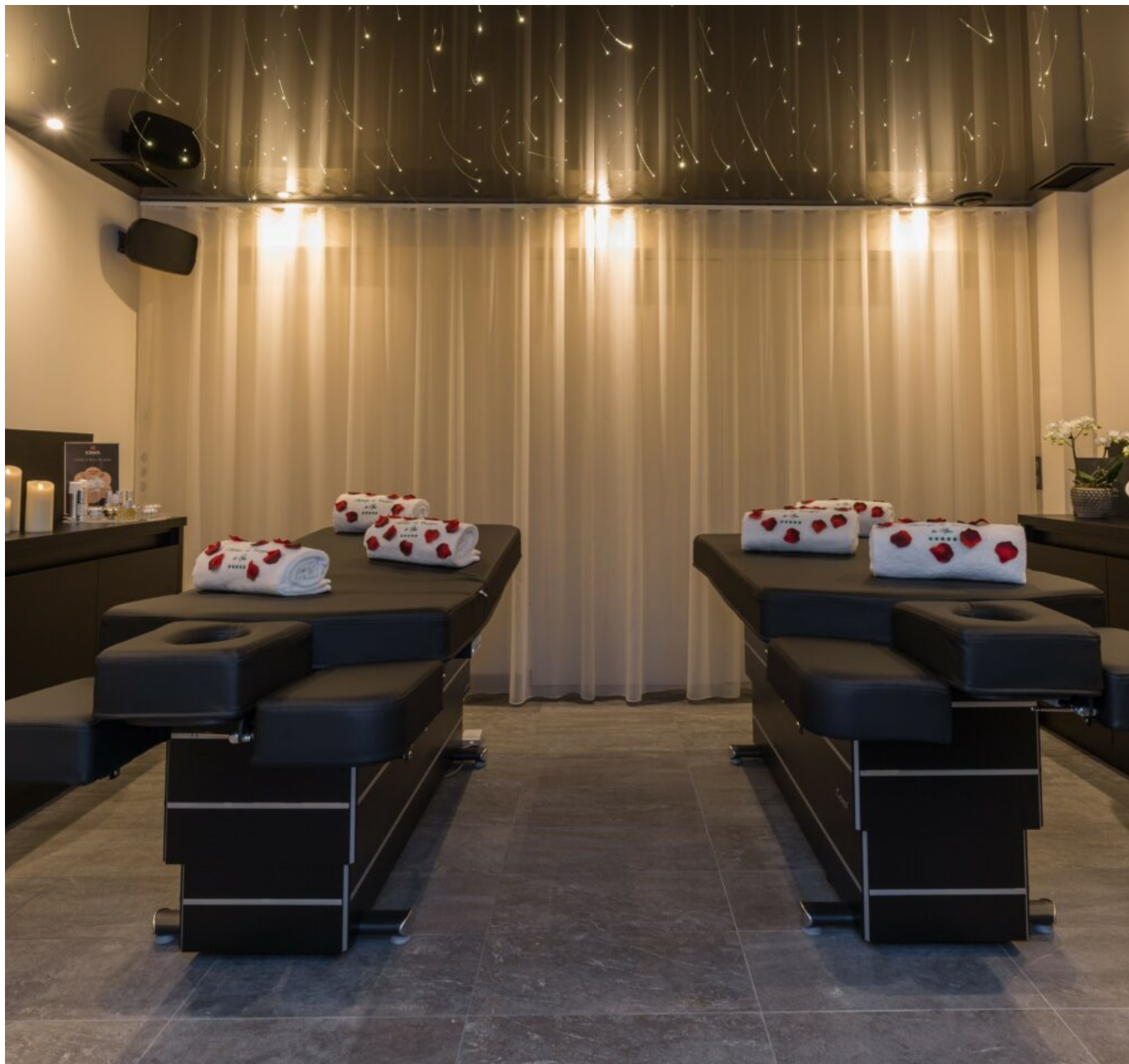
Salle de Massage en duo SPA