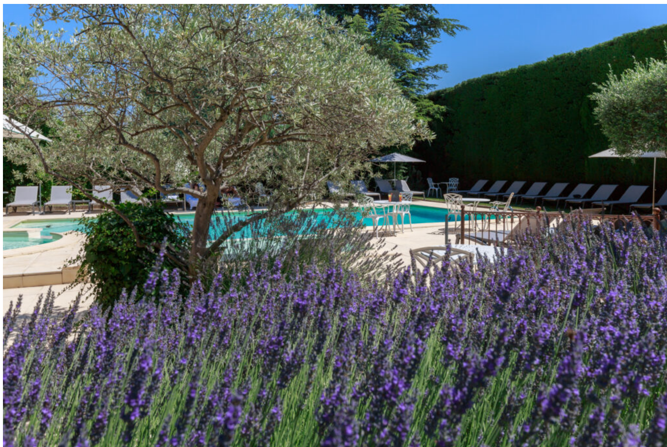
Piscine extérieure