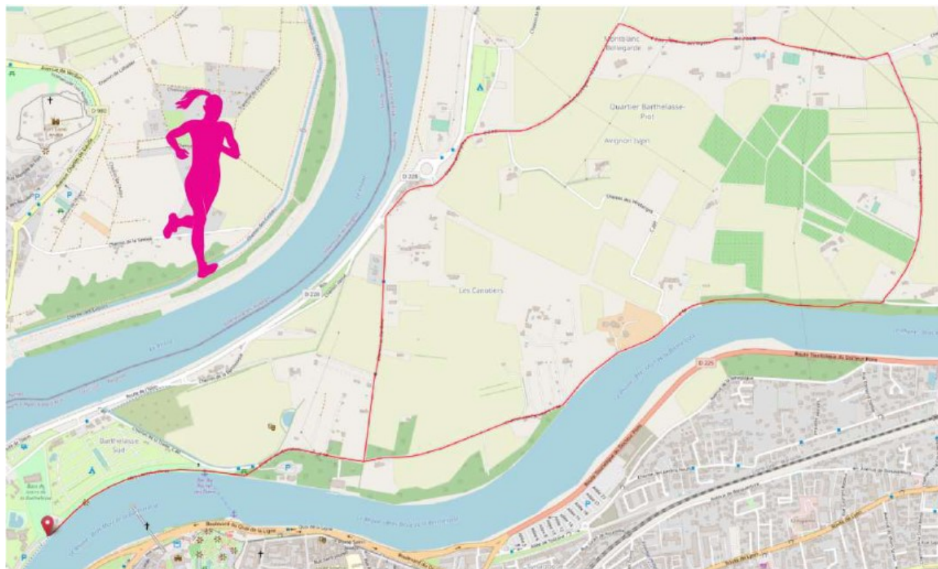
Parcours de course des 8 kms