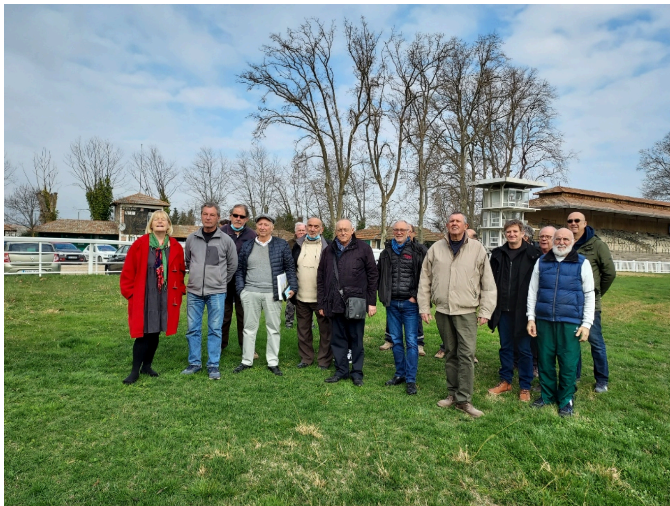
L'équipe des bénévoles entourant le président de la Société hippique d'Avignon-Le Pontet.

Réunions hippiques 2022 à Roberty / Le Pontet : 12 & 28 mars, 10 avril, 2 & 26 mai, 5 & 19 juin.