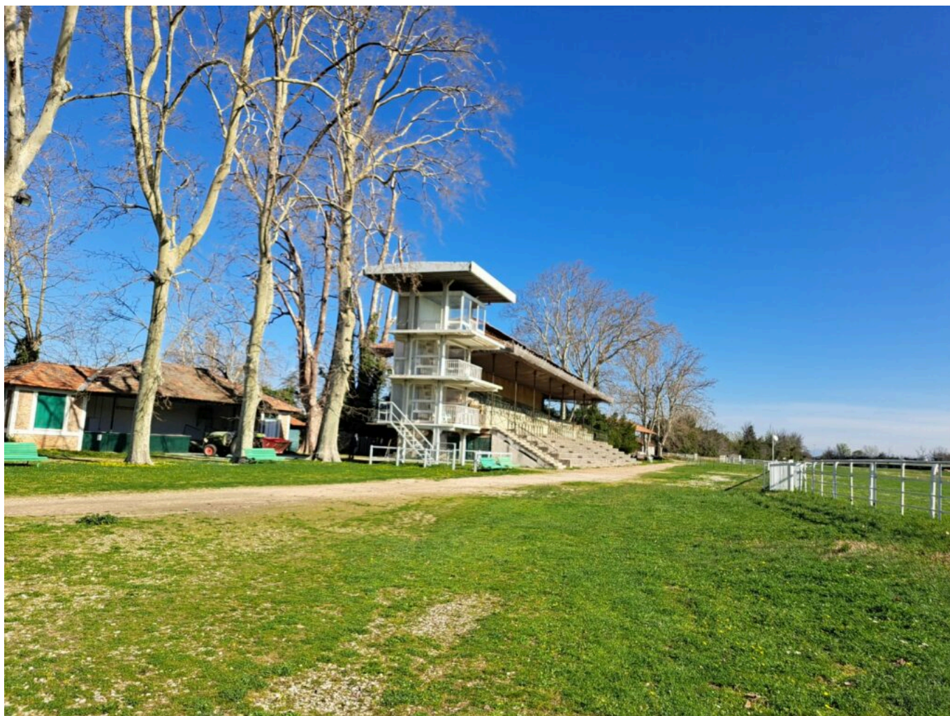
Les tribunes classées Monuments Historiques en 1993

des paddocks. Ils ne comptent pas leurs heures, tous ces bénévoles passionnés. Mais depuis des années, l'état de Roberty se dégrade. Il date de 1868, ses tribunes et anciens haras ont été classés Monuments Historiques en 1993. Il est aussi labellisé 'Unité de Zone Verte', un poumon d'oxygène en milieu urbain avec ses 125 ha de verdure.