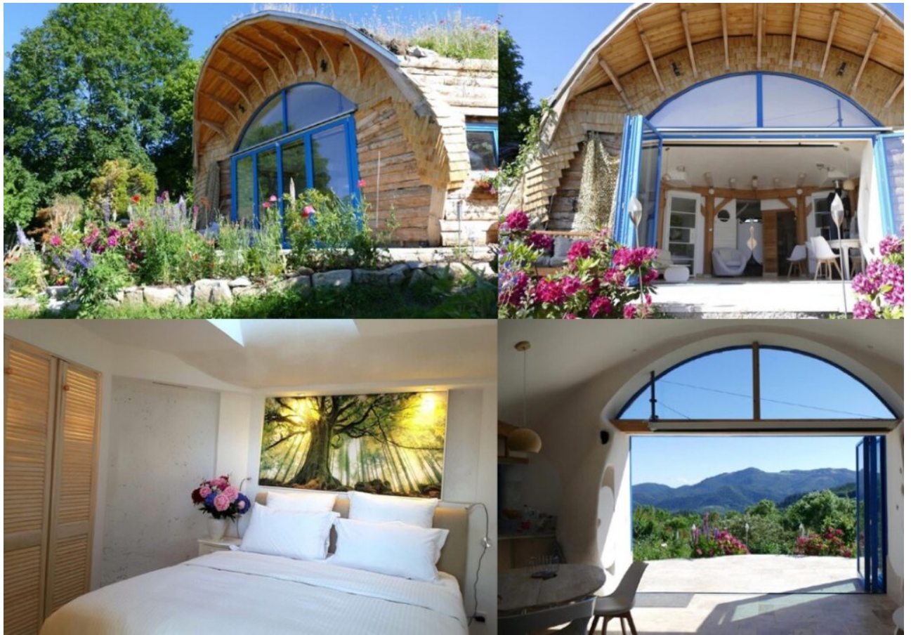
Un éco-gîte 'Panda' dans le Haut-Rhin.