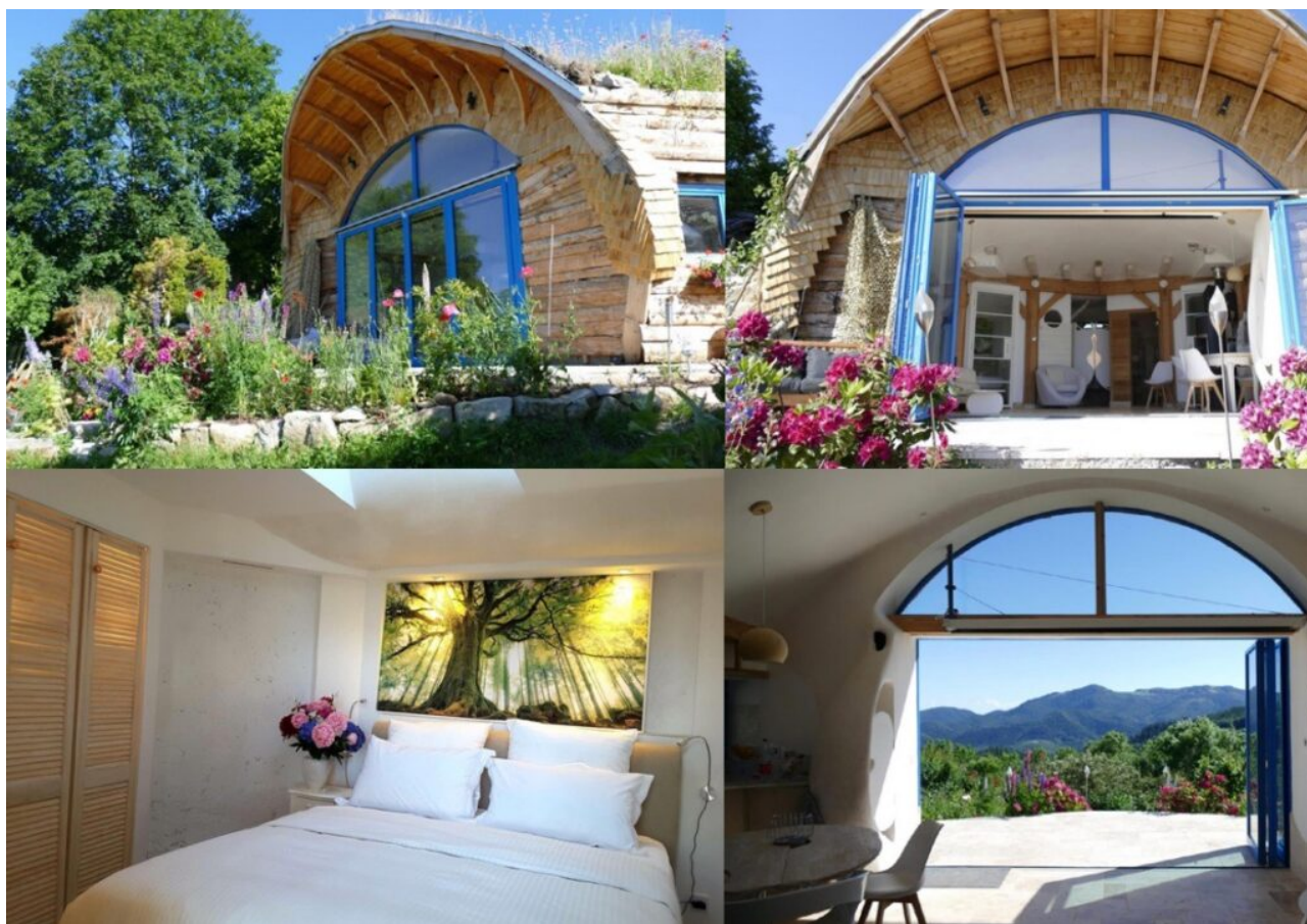
Un éco-gîte 'Panda' dans le Haut-Rhin.