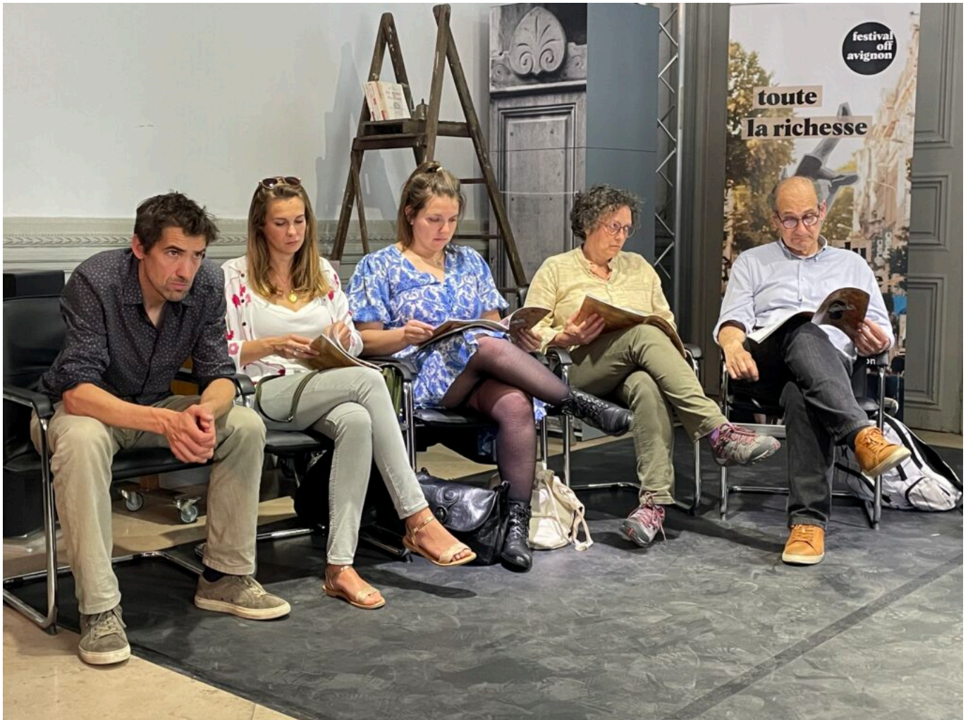
Des membres du Conseil d'administration