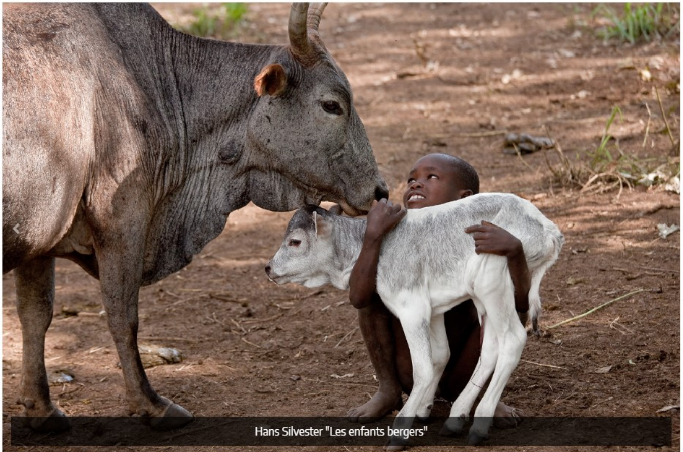
Les enfants berger, Hans Silvester, DR

La galerie d'art et la boutique Retour De Voyage sont ouvertes du mercredi au samedi de 10h30 à 13h et de 15h30 à 19h le dimanche de 9h30 à 13h30 et de 14h à 17h Et sur rendez-vous au 06 87 32 58 58. Retour de voyage, la maison sur la Sorgue , Place Rose Goudard à l'isle-sur-la-Sorgue. contact@lamaisonsurlasorgue.com ; www.lamaisonsurlasorgue.com ; www.retourdevoyage.com