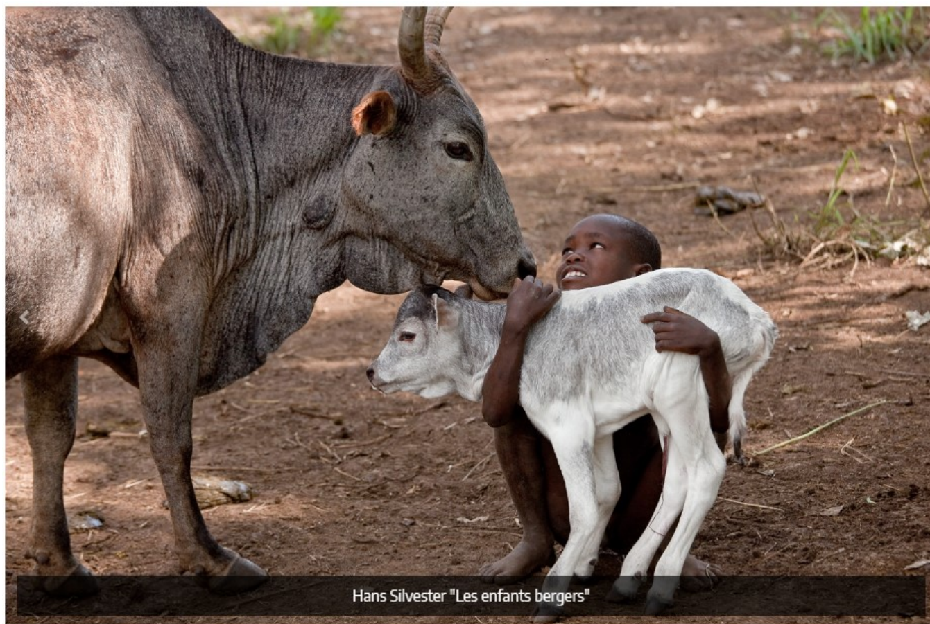
Les enfants berger, Hans Silvester, DR

La galerie d'art et la boutique Retour De Voyage sont ouvertes du mercredi au samedi de 10h30 à 13h et de 15h30 à 19h le dimanche de 9h30 à 13h30 et de 14h à 17h Et sur rendez-vous au 06 87 32 58 58. Retour de voyage, la maison sur la Sorgue , Place Rose Goudard à l'isle-sur-la-Sorgue. contact@lamaisonsurlasorgue.com ; www.lamaisonsurlasorgue.com ; www.retourdevoyage.com