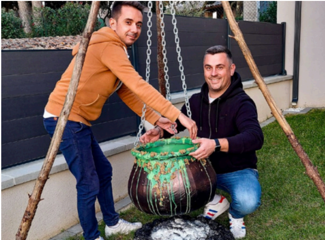
Les Ludovic en pleine préparation des décors.

Manoir de Comps n'a rien à leur envier. Cette année, le public pourra y admirer des décorations sur-mesure et animées faites avec des objets de seconde-main récupérés en brocante ou sur des sites de revente. Araignées géantes, chaudrons magiques et squelettes seront de mise.