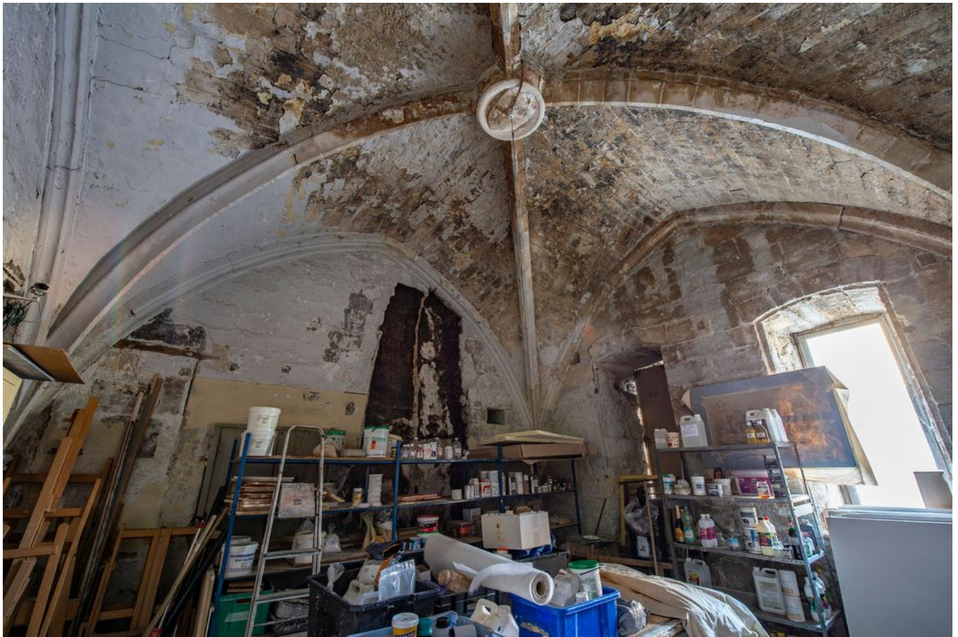
La Maison du Roi René.