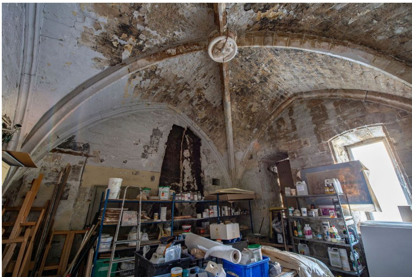
La Maison du Roi René.