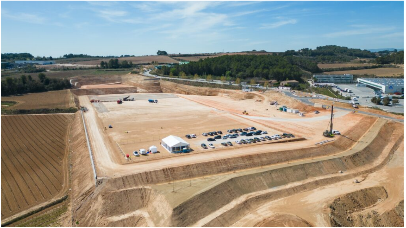
Site du futur ensemble logistique pour GLP à Barcelone