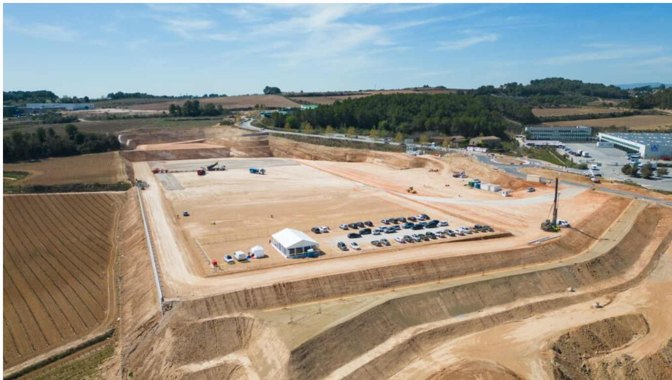
Site du futur ensemble logistique pour GLP à Barcelone