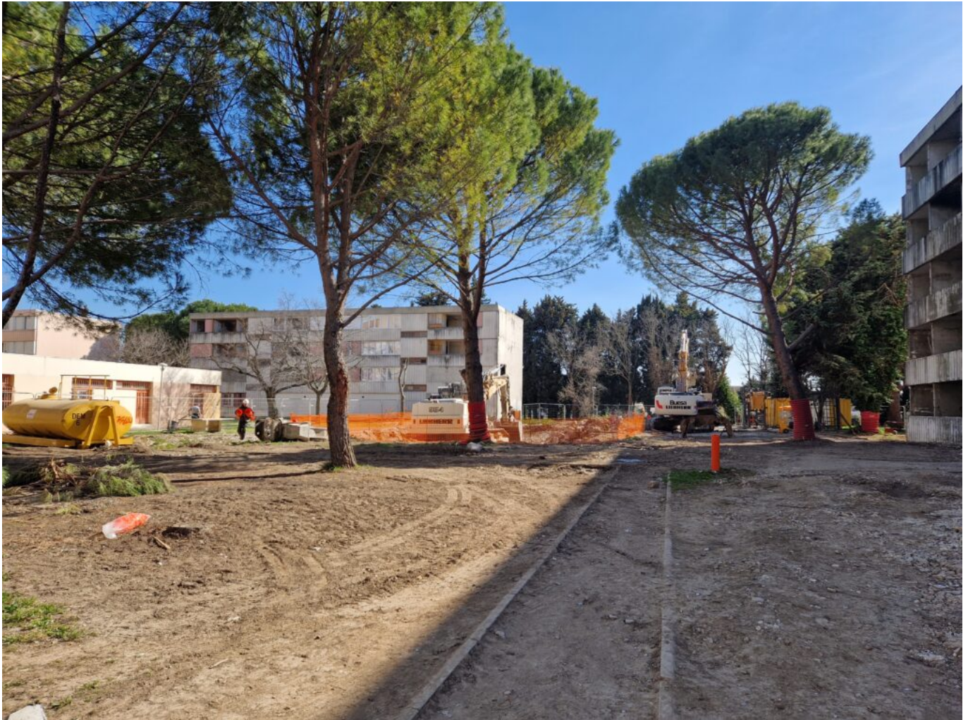
Le chantier en cours

Déjà très engagée au côté de l'Anru (Agence nationale de renouvellement urbain) sur les communes d'Avignon, de Cavaillon et de Carpentras, la coopérative Grand Delta Habitat participe au projet de renouvellement urbain du quartier de l'Aygues pour la démolition et la réhabilitation des logements de la résidence éponyme, initialement composée de 260 appartements.