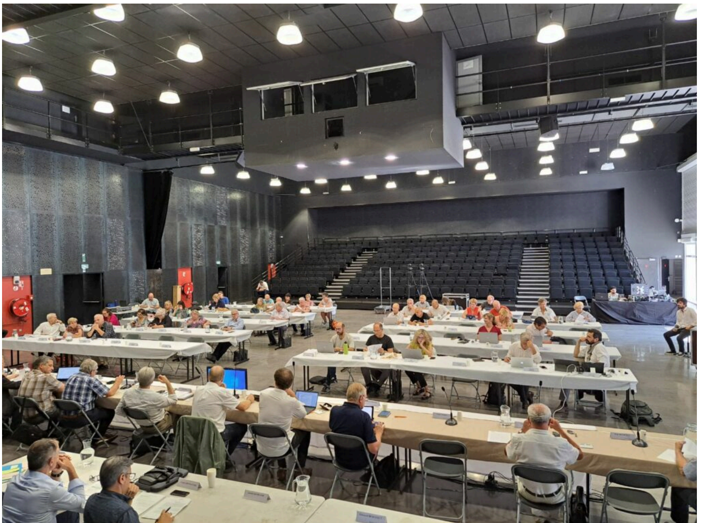
Les élus communautaires lors de la séance plénière du lundi 26 juin 2023.

Suit un power-point sur ce compte administratif avec d'abord les recettes : 366M€, en augmentation de + 4,1% alors qu'en 2019-2021 (COVID), elle n'était que de 1,1%. Côté dépenses : 343M€. Ce qui contribue à un désendettement de 23M€ avec un auto-financement brut qui se maintient à plus de 39M€.