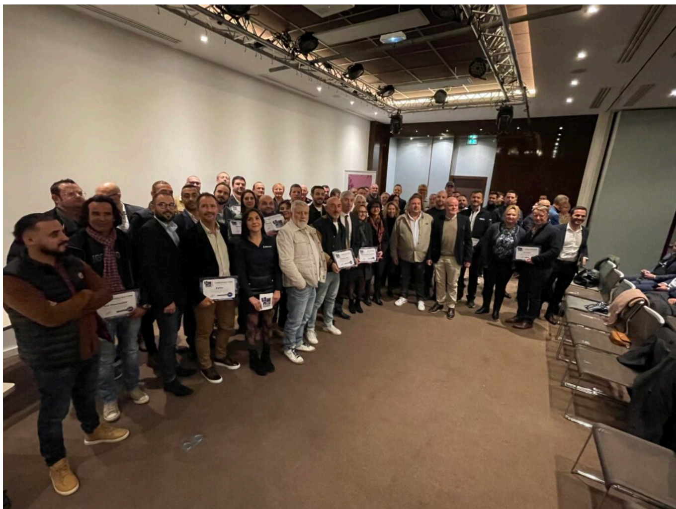
Les 47 représentants des entreprises labellisées par Grand Delta Habitat