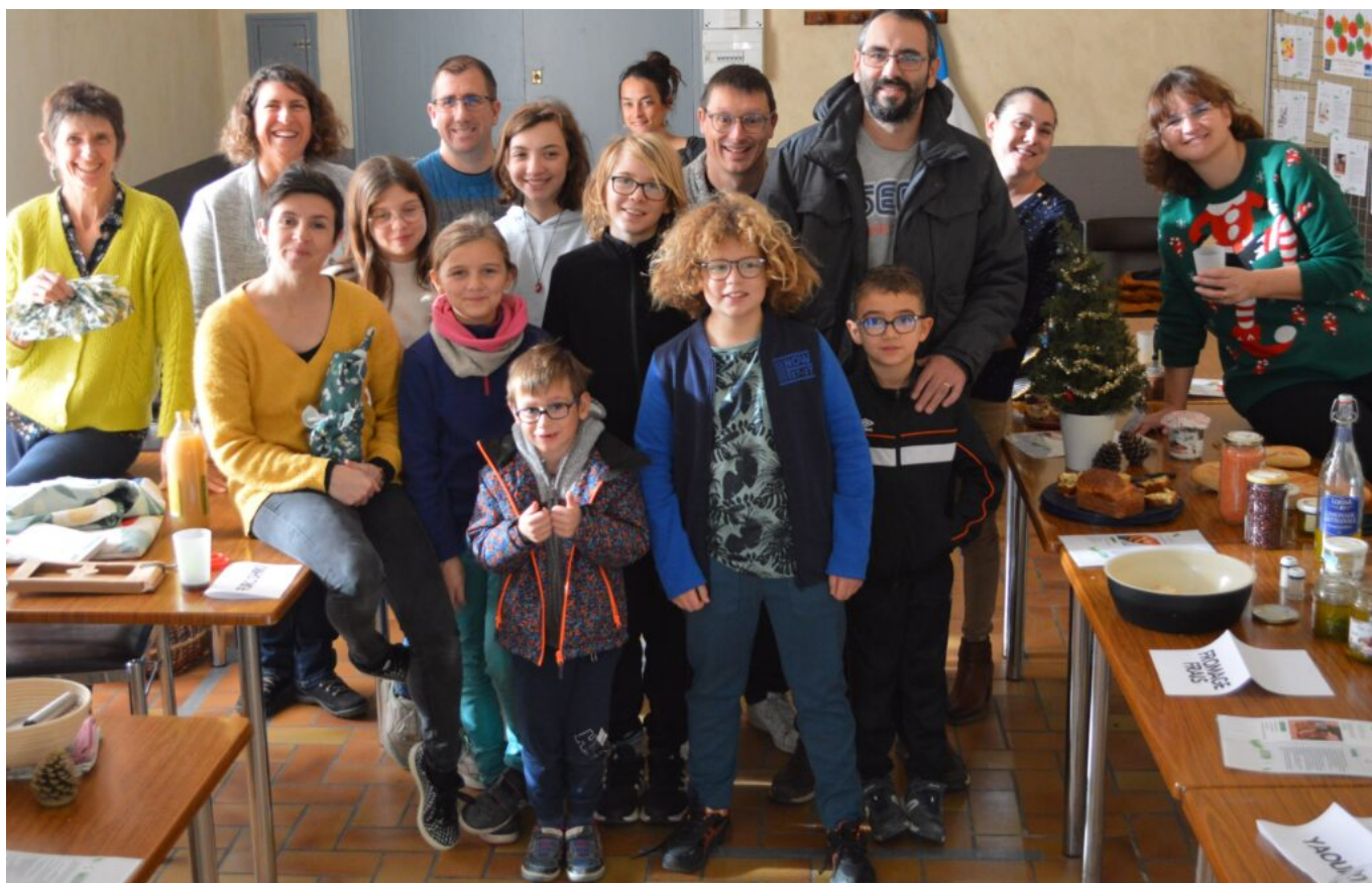
Les familles zéro déchets