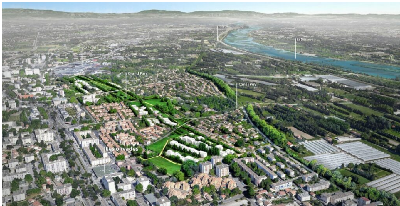
L'éco-quartier de Joly-Jean.