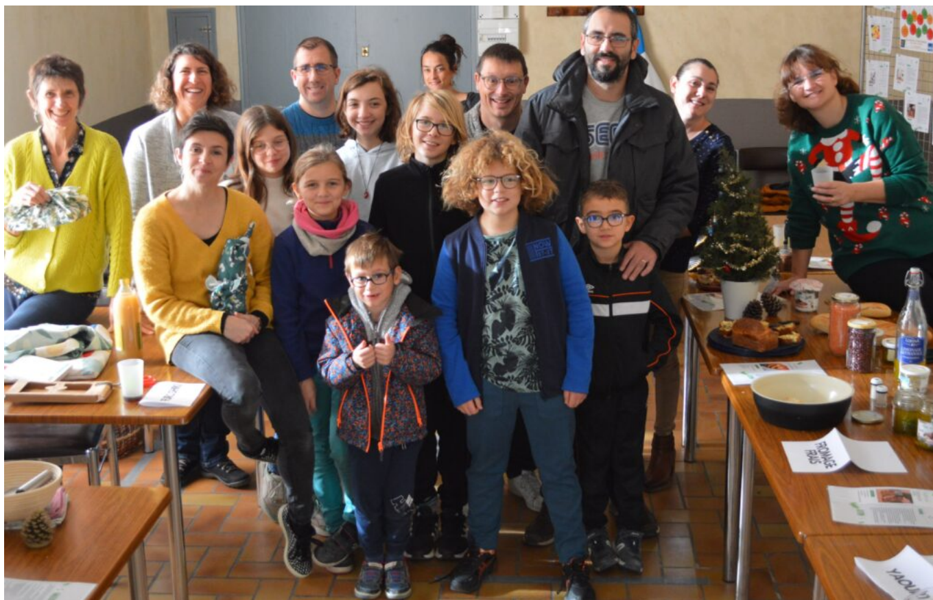
Les familles zéro déchets