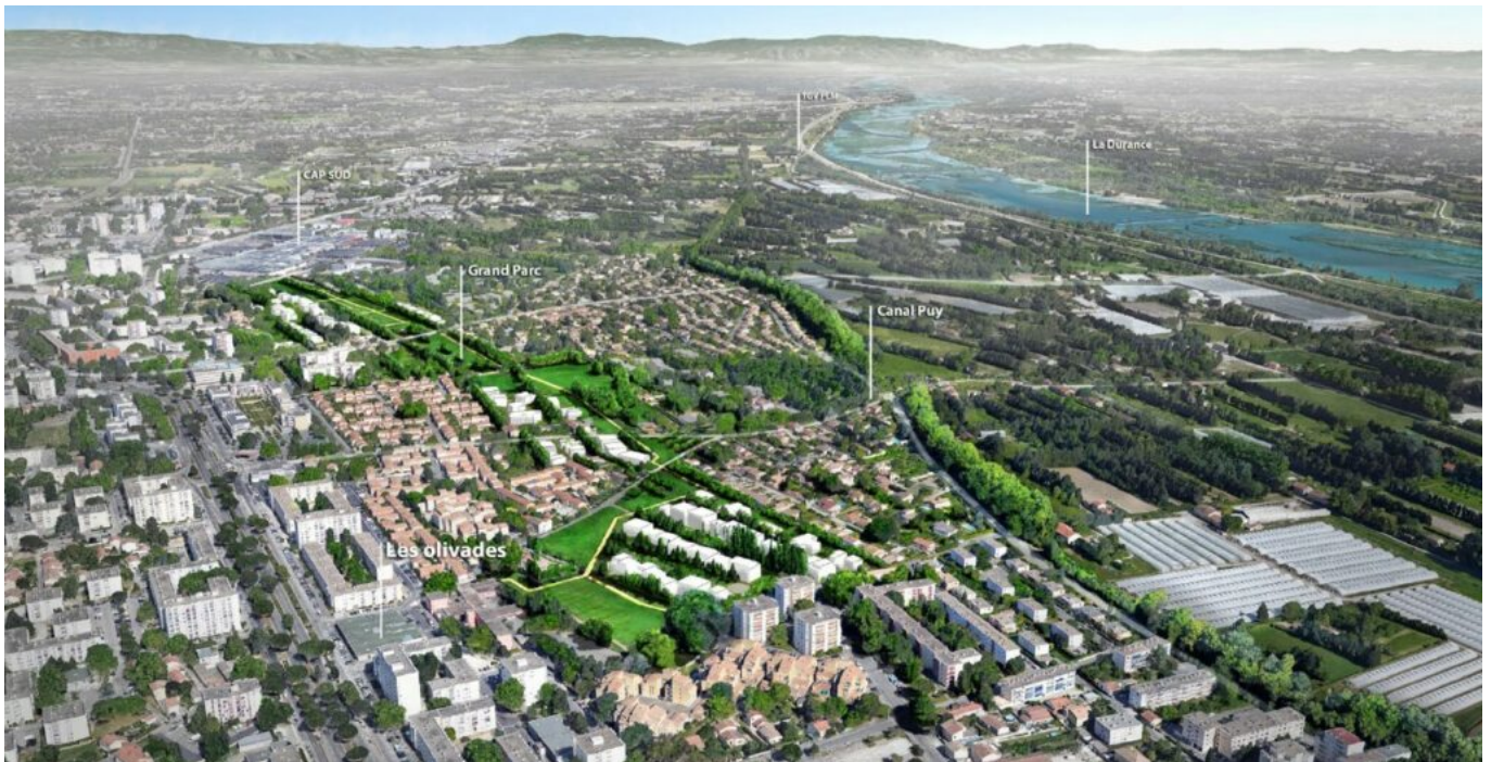
L'éco-quartier de Joly-Jean.

outil, plus performant, plus souple et nous allons travailler en totale collaboration avec le Grand Avignon, ajoute Cécile Helle. Déjà avec l'éco-quartier Joly Jean nous avons cheminé ensemble, les appartements seront livrés dès la rentrée prochaine, la nouvelle école ouvrira en septembre 2023 avec, en plus des 11 classes maternelles et élémentaires, un potager pédagogique, une halle créative et un studio musical. Le tout dans un cadre végétalisé, avec mixité sociale, déplacements doux et label BDM (Bâtiment durable méditerranéen). »