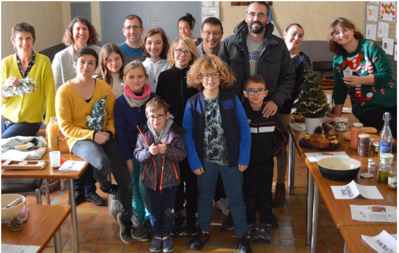
Les familles zéro déchets