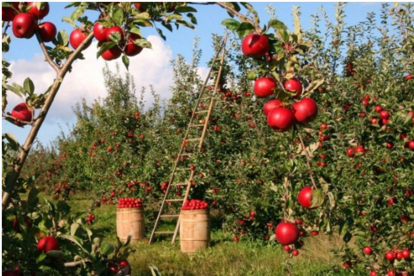
Vergers de pommes