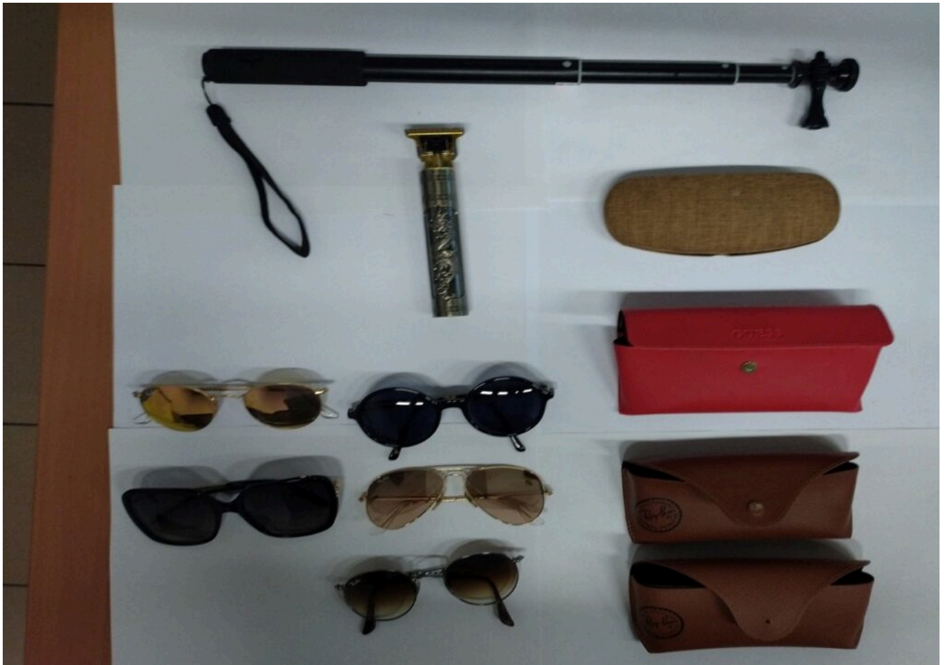
Objets trouvés