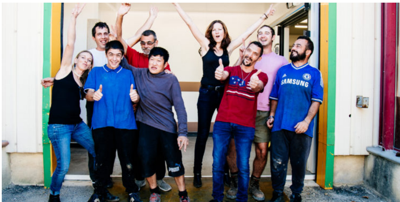
Les jardins de Solène

Lire aussi : Pernes-les-Fontaines : 'Les jardins de Solène' décrochent un grand prix