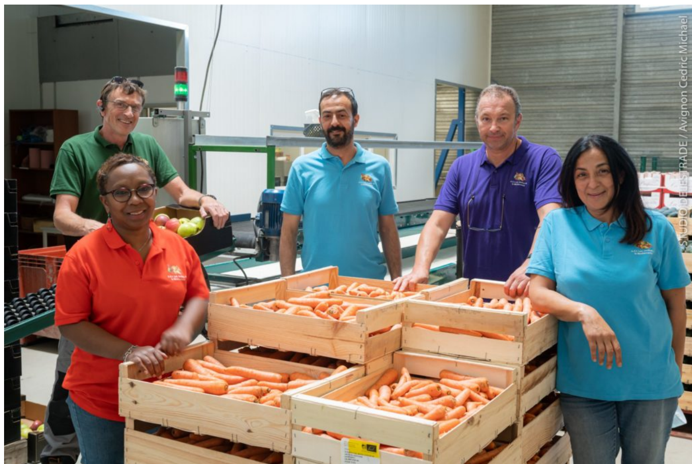
'Jardins de la Méditerranée'.