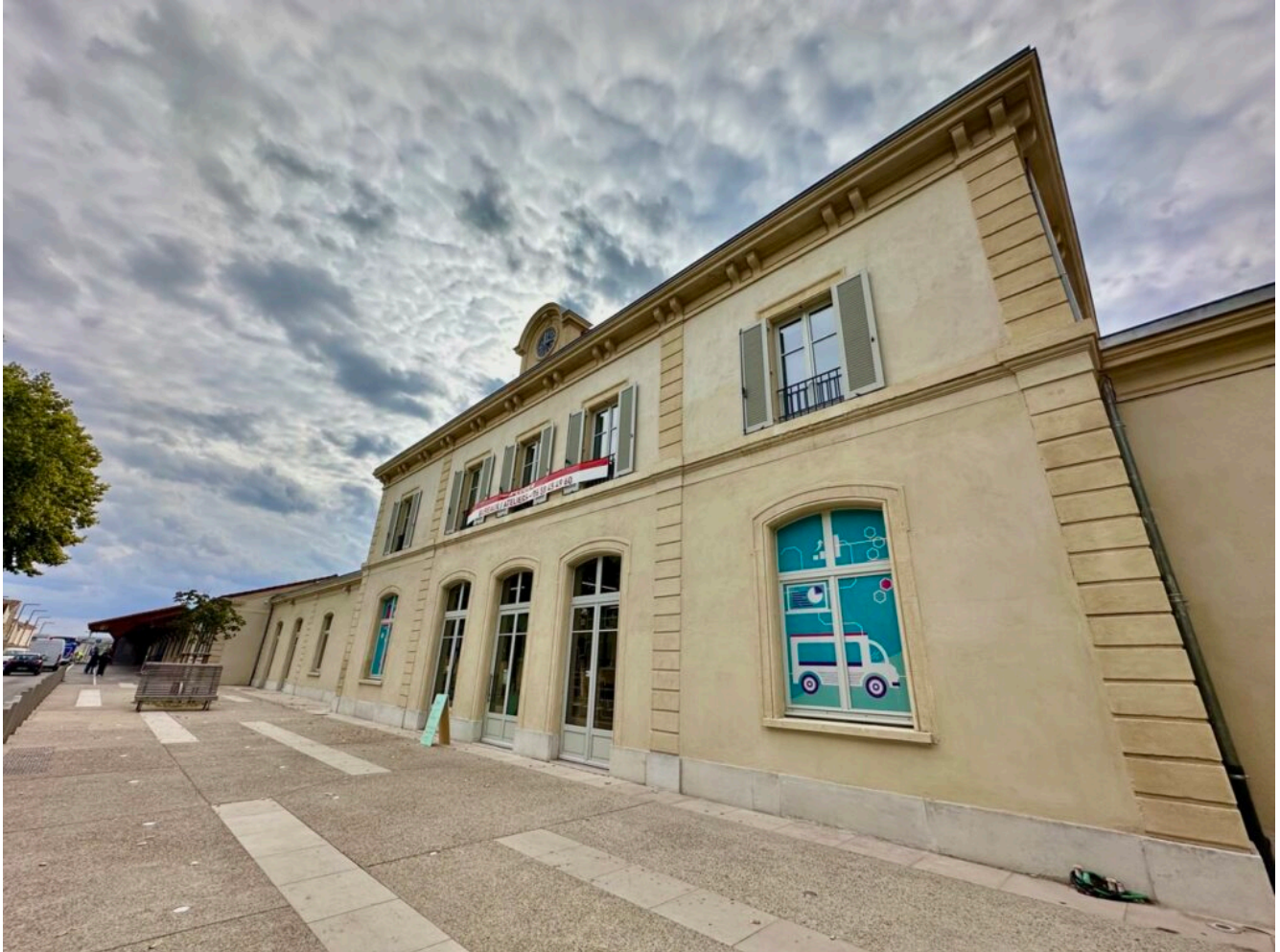
La Gare numérique, vue du côté de l'Avenue de la gare.

être très fiers de cette réhabilitation. »