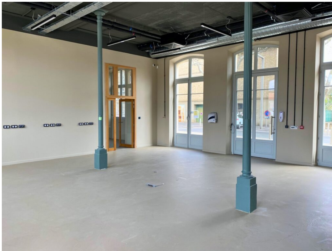
Un exemple d'atelier à louer.