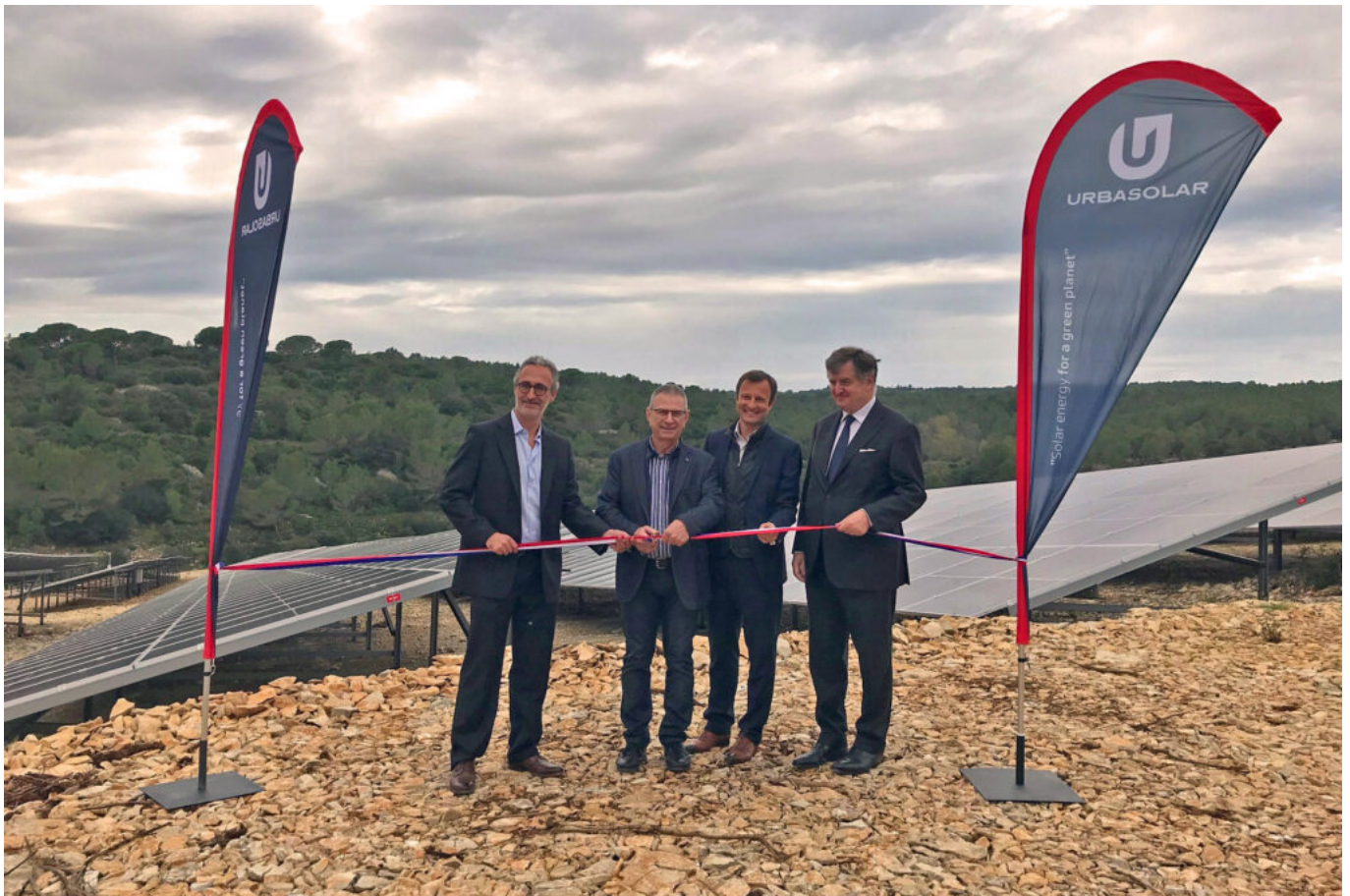
Inauguration de la centrale solaire de Caveirac en novembre 2022 © DR.

Avec une production annuelle attendue de 47 GWh d'énergie verte sur une durée de 21 ans, ce contrat d'approvisionnement direct en électricité, le premier signé par un groupe aéroportuaire, représente 10% des besoins en électricité annuels pour faire fonctionner les trois aéroports parisiens ou encore près de 75% des besoins en éclairage.