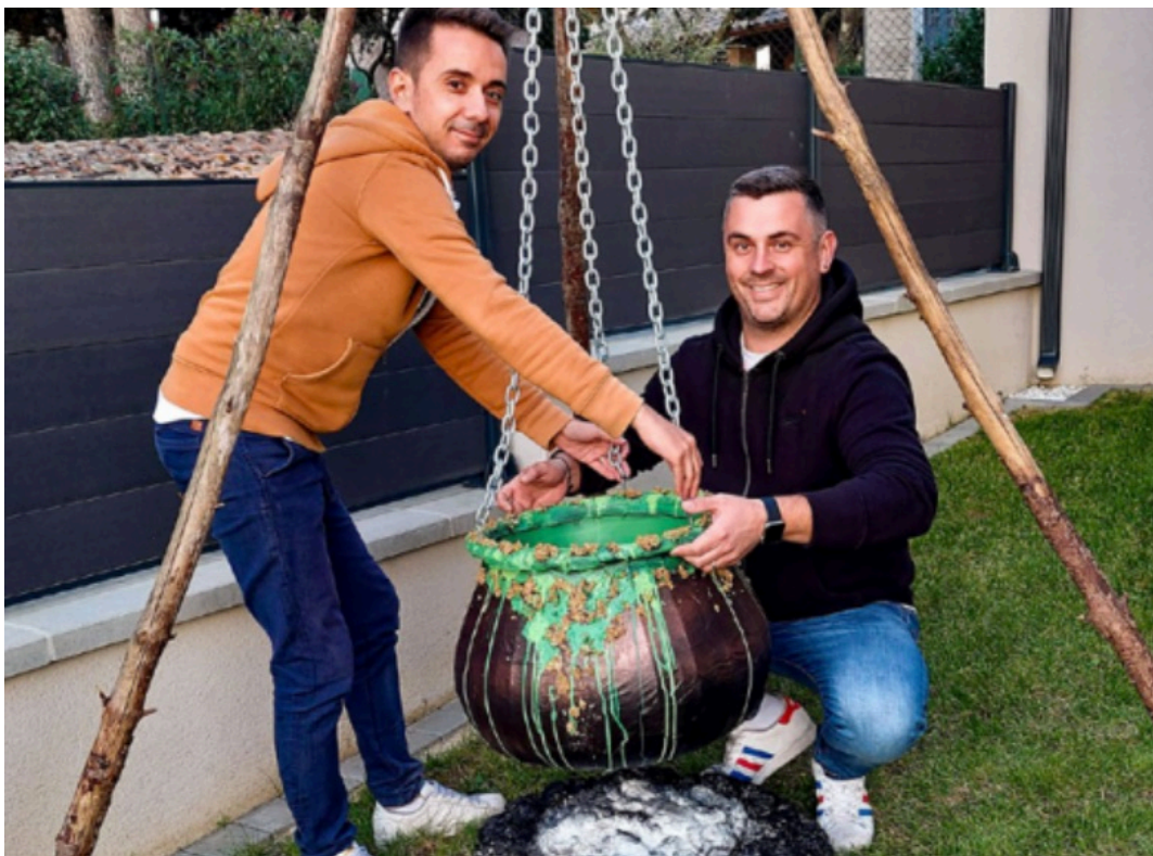
Les Ludovic en pleine préparation des décors.

Si les Américains sont les champions d'Halloween en termes de déguisements et de décorations, le Manoir de Comps n'a rien à leur envier. Cette année, le public pourra y admirer des décorations sur-mesure et animées faites avec des objets de seconde-main récupérés en brocante ou sur des sites de revente. Araignées géantes, chaudrons magiques et squelettes seront de mise.