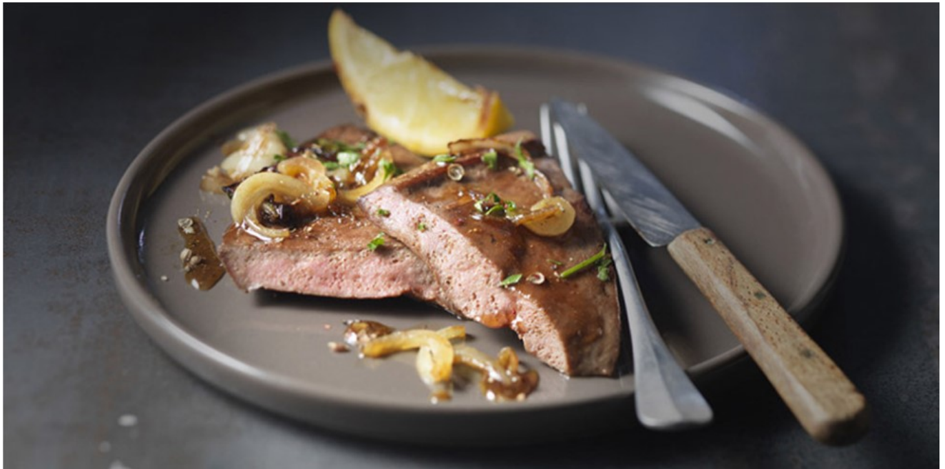
Foie de veau cuisiné