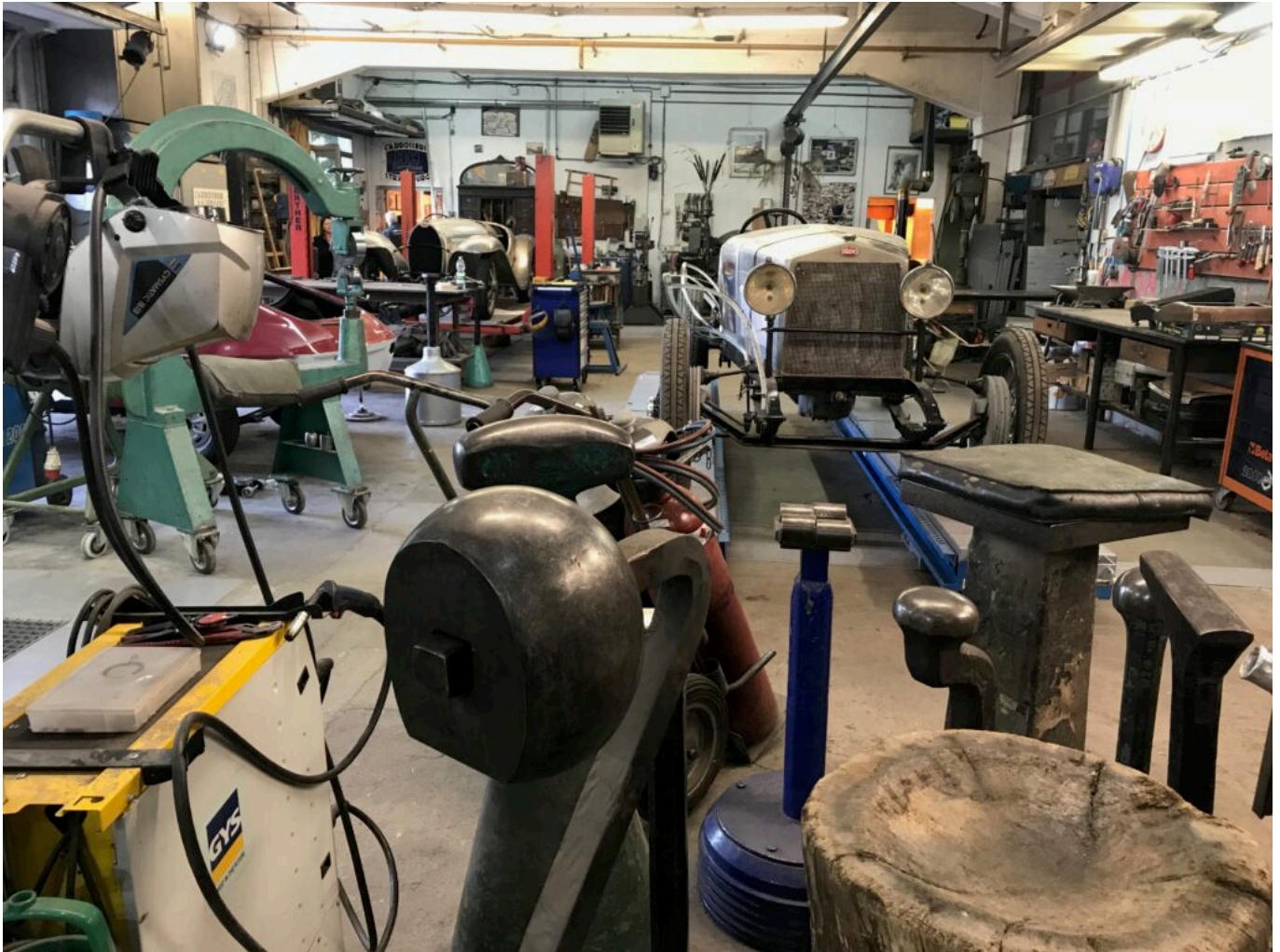
un atelier de restauration