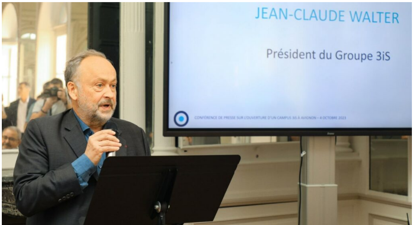
Le président de 3IS.

Les élèves de 3IS affichent un taux d'insertion professionnelle de 84% suivant la première année d'obtention de leur diplôme.