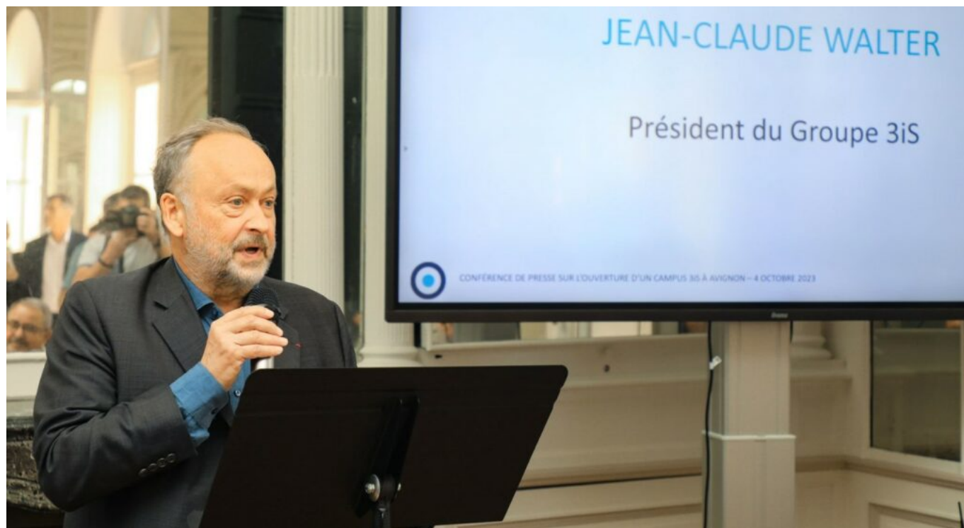
Le président de 3IS.

Les élèves de 3IS affichent un taux d'insertion professionnelle de 84% suivant la première année d'obtention de leur diplôme.