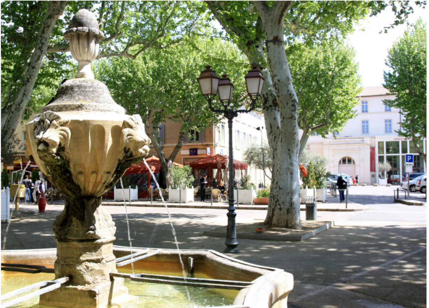
HOCQUEL A - VPA

Cet été, la ville de Carpentras a enregistré une hausse de fréquentation de 17% de son centre-ville. Dans le détail, cette augmentation s'élève à 15% durant le mois de juin, 20% en juillet, 26% en août et 17% en septembre par rapport à l'été 2022. Ce sont très précisément 780 100 piétons en juin, 769 500 piétons en juillet, 722 700 piétons en août et 779 400 piétons en septembre qui sont venus dans le centre de Carpentras