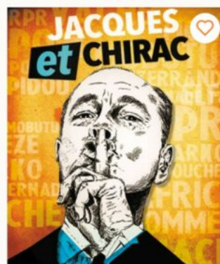
Jacques et Chirac