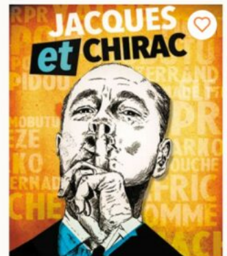
Jacques et Chirac