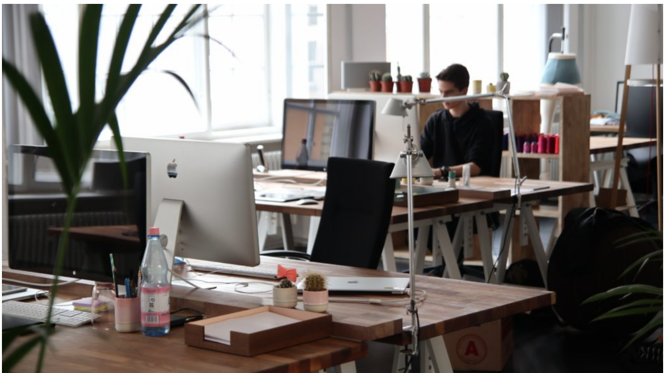
Table ronde : 'Quand le design s'invite dans les entreprises'

'Quand le design s'invite dans les entreprises', voici l'intitulé de la prochaine table ronde, animée par Rémi Sabouraud , consultant en créativité. Le 24 septembre, à 17h à la salle de l'étoile à Chateaufort, 5 entreprises partageront leur expérience : La Grangette, Dusud,