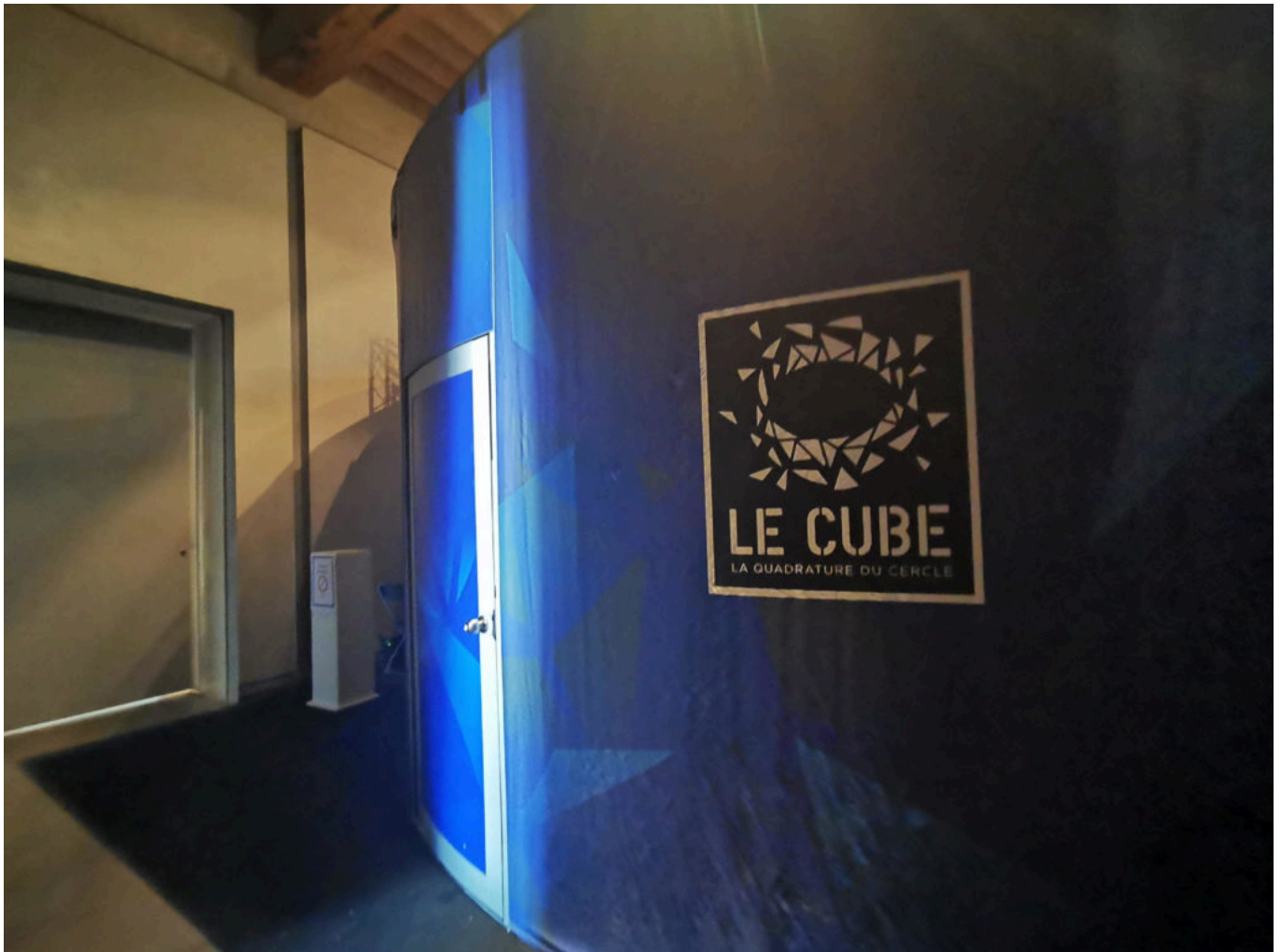
Le cube se dresse et vous appelle à l'évasion.