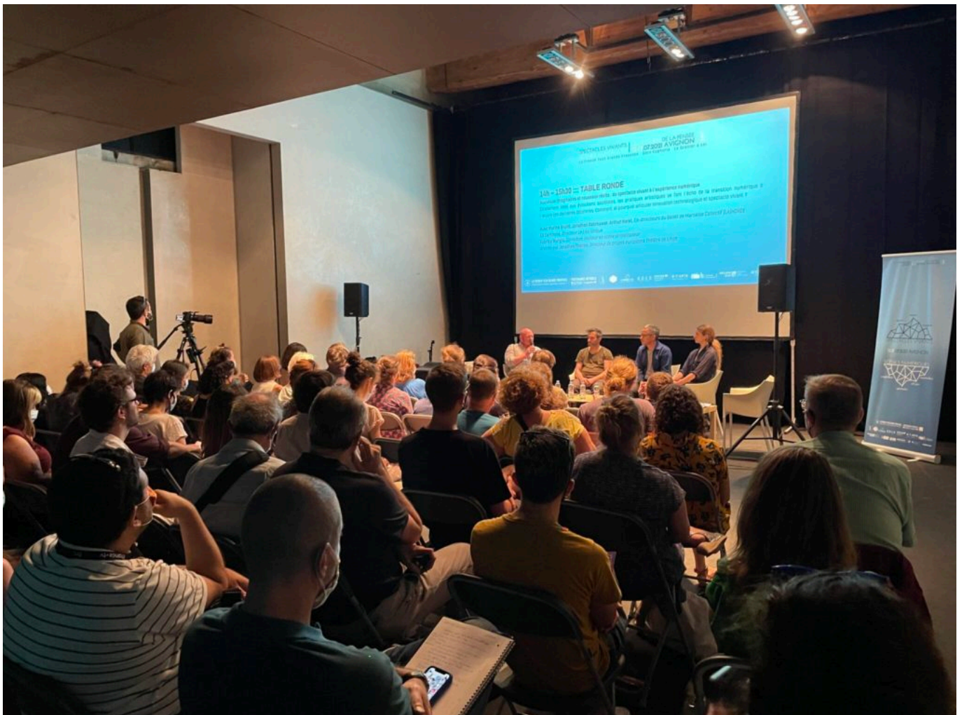
Carton plein pour les rencontres de la French Tech Grande Provence.