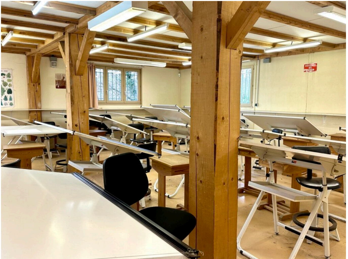
La salle de dessin.