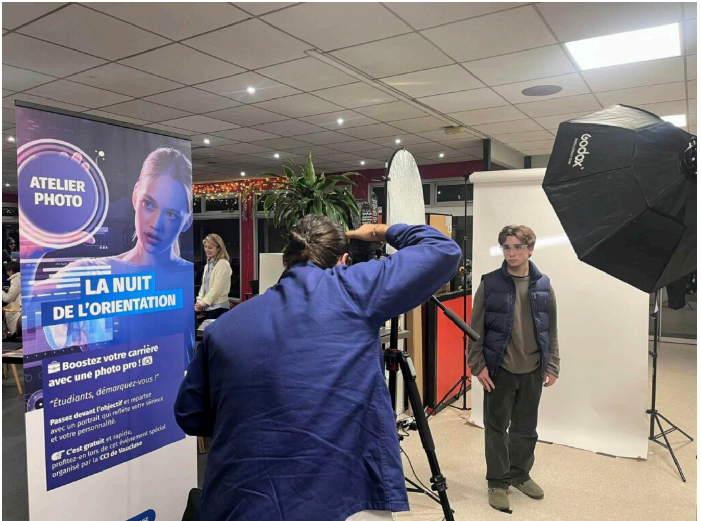
L'événement a permis de renouveler les photos pour les CV.