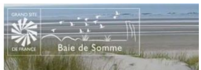
variante blanc sur fond transparent