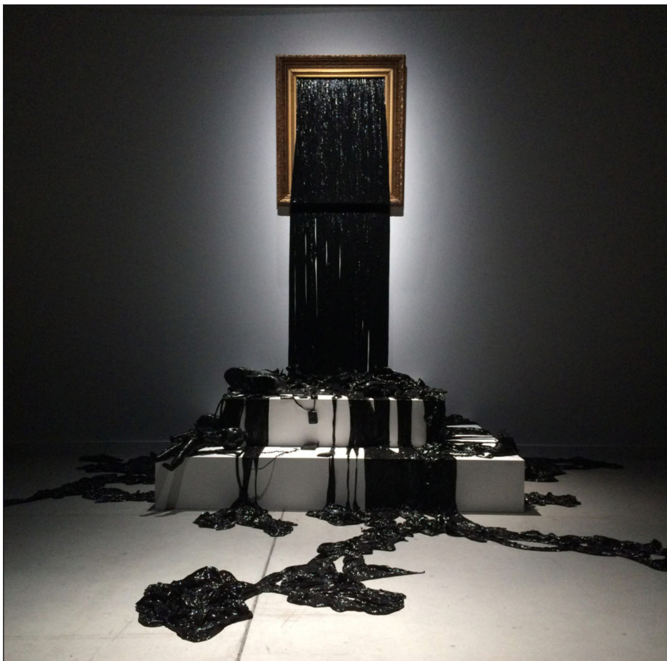
Film noir dans un cadre doré, Clay Apenouvon