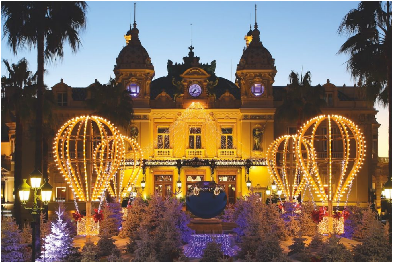
Blachère illuminations à Monaco.