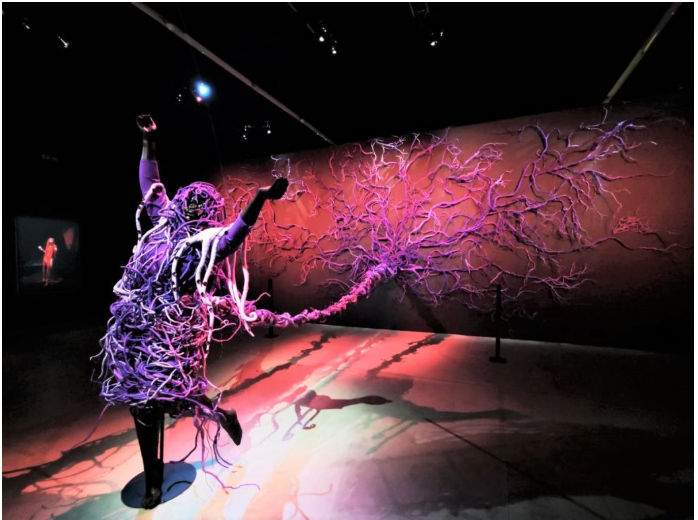
Mary Sibande, 'A Reversed Retrogress: Scene 2'.