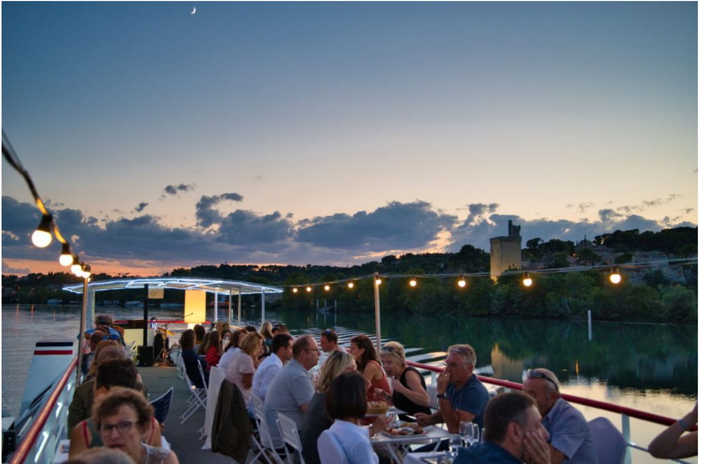
Le soleil se couche sur Villeneuve-lez-Avignon