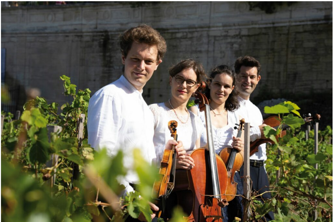
Le quatuor Girard.