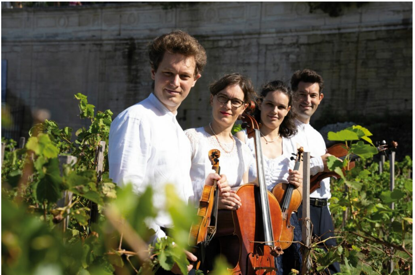
Le quatuor Girard.