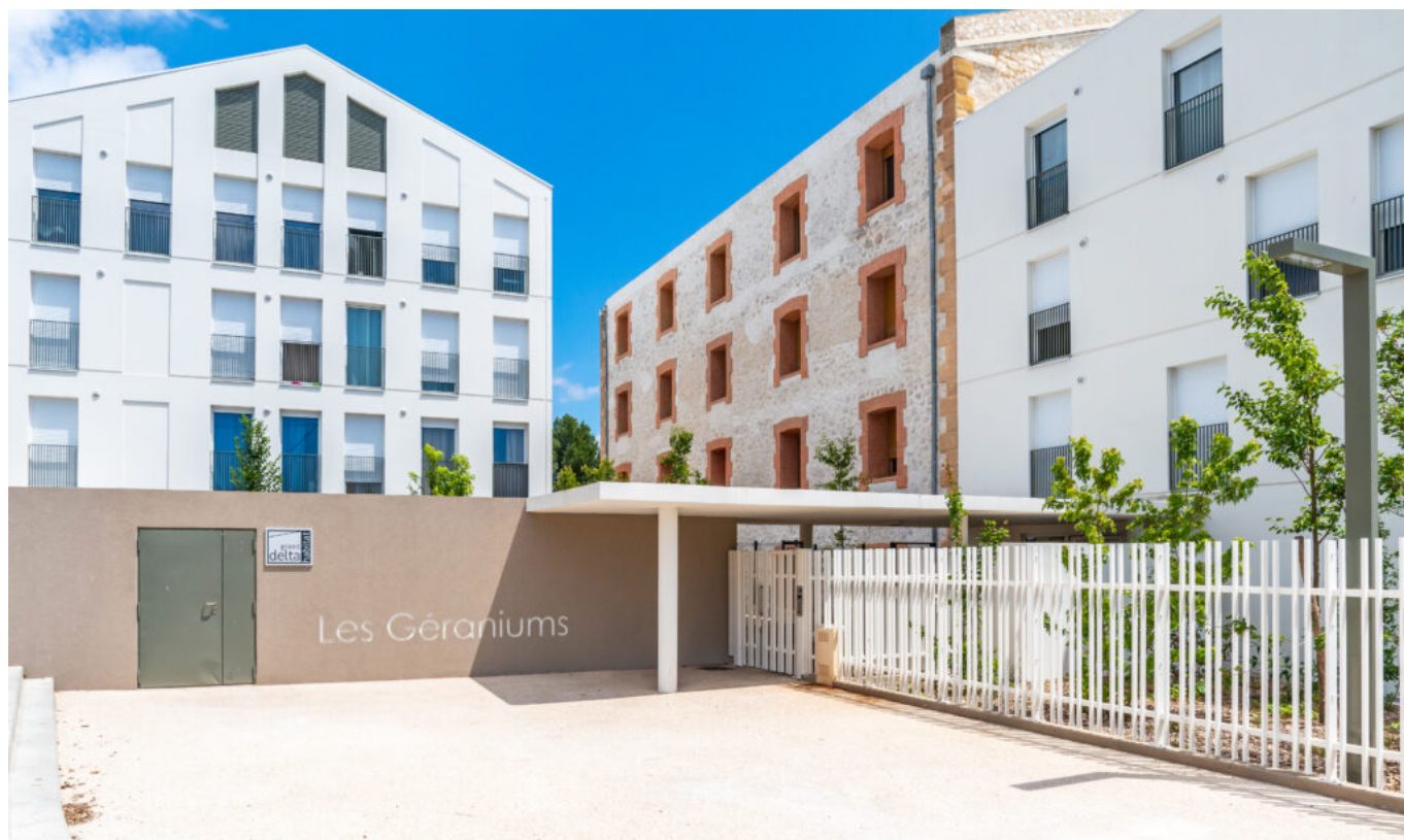
Les Gèraniums