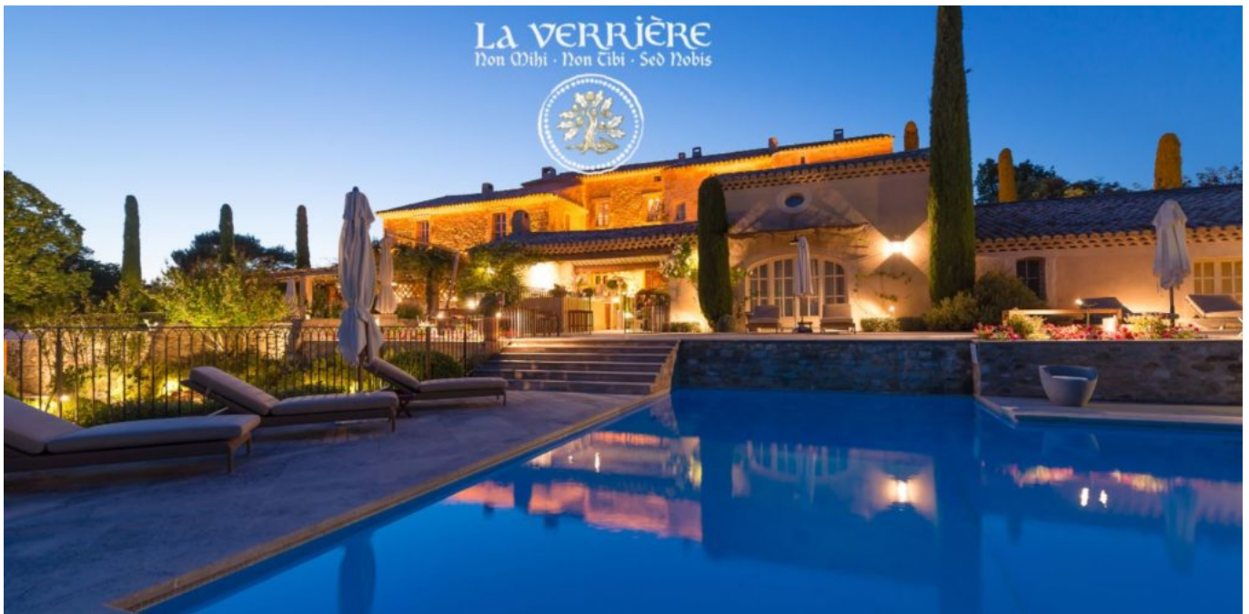
Le crépuscule des Dieux. @La Verrière

navigue entre les croyances ancrées du Moyen Âge, le taureau Vintur, Dieu du mal qui récolte les sacrifices humains (à l'origine du Mont Ventoux), la déesse Vaison et toute la symbolique de fertilité autour de la nature. Installé confortablement, son regard au loin se laisse transporter, animé d'une sagesse réconfortante. L'aura émanant de l'ancienne bastide du XVIII e est mystique.