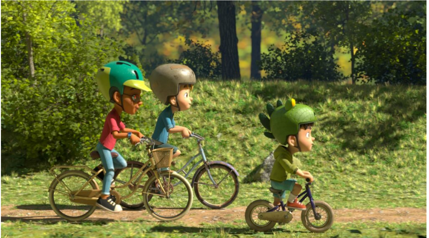
Partie de Campagne © La Station Animation

Plus qu'un soutien, Loïc Etienne accompagnera le studio Station animation dans toutes les démarches jusqu'au choix des locaux. Installé dans des locaux de 150 mètres carré au cœur du centre-ville, la société dispose de tous les aménagements pour accueillir la quinzaine de modeleurs, 'textureurs' et quelques 'setupeurs' qui travaillent au quotidien pour le studio.