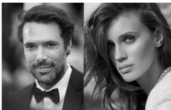
Nicolas Bedos (réalisateur) et Marine Vacth (actrice)

L'avant-première aura lieu le samedi 29 octobre à 20h, quelques jours avant la sortie officielle prévue le 1er novembre. Pour assister à cet évènement, il faut réserver sa place à la caisse ou sur internet .