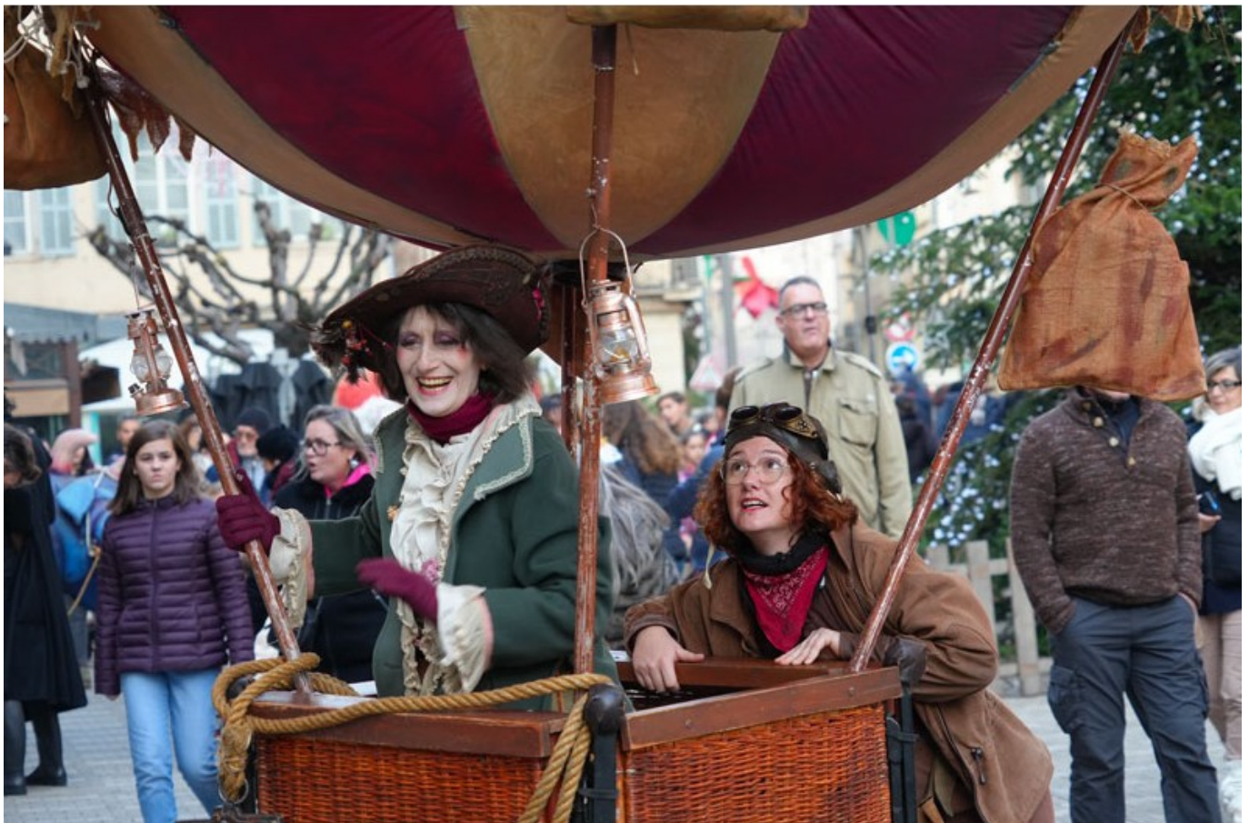
Déambulations dans la rue, Les filles de l'air

La fréquentation des spectacles au chaud des 'Noëls Insolites 2024' a été globalement très élevée. Plusieurs représentations, comme celles de « La renne de Noël » ou « Debout là-dedans », « Léonie en hiver » « Kéto ou la recherche du silence », ont affiché complet, atteignant 100 % de leur capacité. Les autres spectacles ont également connu un succès significatif, avec des taux de remplissage variant entre 65,5 % et 99,5 %. La diversité des spectacles et l'organisation bien répartie sur plusieurs jours ont contribué à cet engouement, confirmant l'attractivité de cet événement pendant les fêtes.