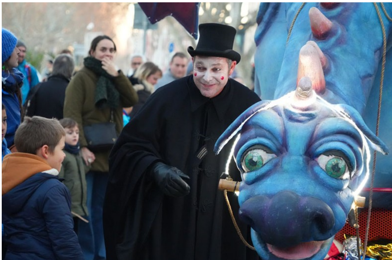
Déambulations dans la rue, La balade de Léon