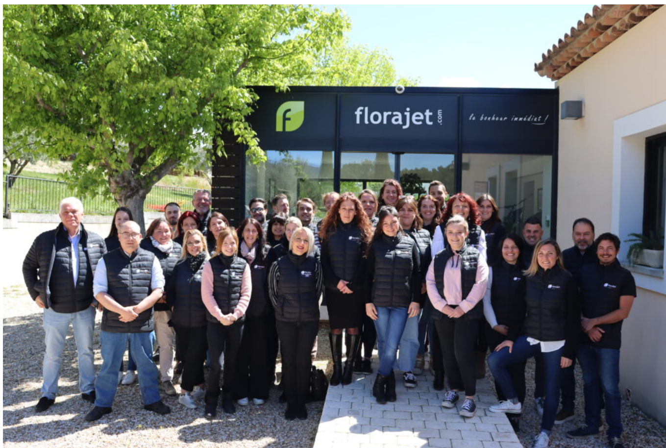
L'équipe de Florajet à Cabrières d'Aigues.

*Étude réalisée par Florajet en collaboration avec Opinionway auprès d'un échantillon de 1 048 personnes représentatif de la population Française âgée de 18 ans et plus, du 3 au 6 mai 2024. Opinionway a réalisé cette enquête en appliquant les procédures et règles de la norme ISO 2052