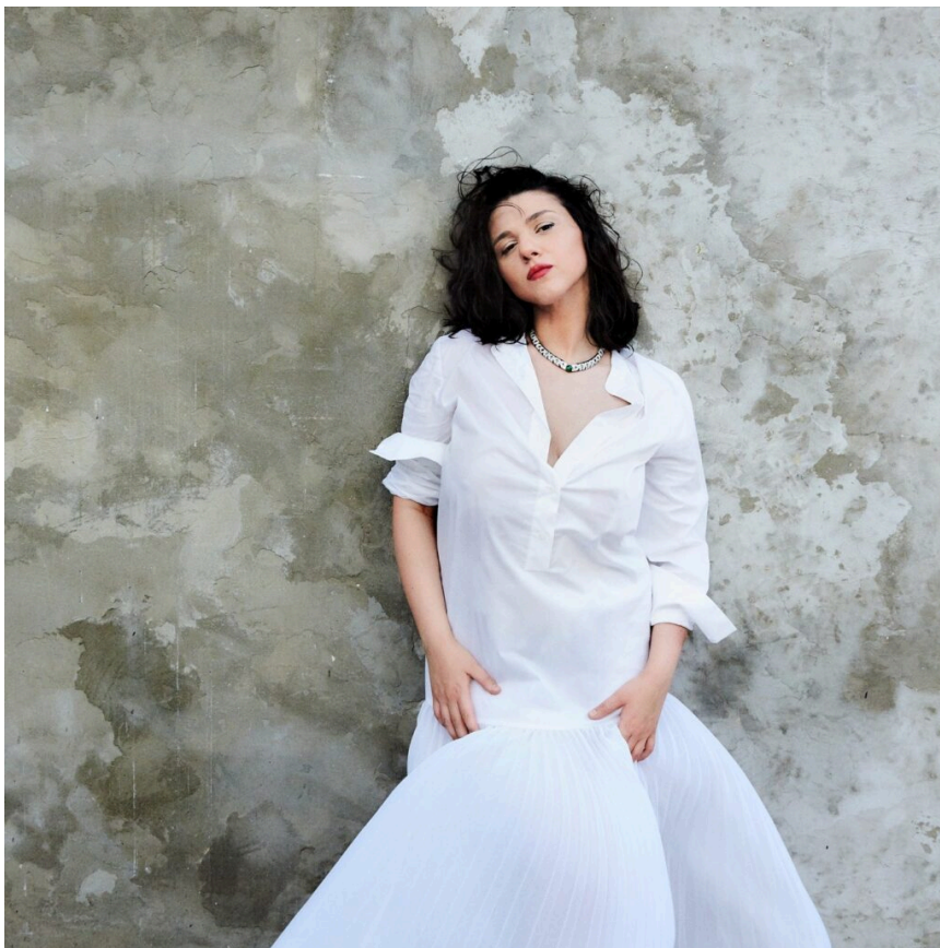
Khatia Buniatishvili.

Mais 2023 sera à coup sûr sublime ! Avec dès l'ouverture, le 2 juillet, une icône, une véritable rock-star du piano, Khatia Buniatishvili qui a donné son 1er concert à l'âge de 6 ans. Elle a remporté le Grand Prix Horowitz à Kiev en 2003 puis le Prix du Public au Concours Arthur Rubinstein en 2008. Depuis, elle parcourt la planète pour une carrière internationale et elle viendra pour la 1ère fois aux Chorégies interpréter l'émouvant Concerto pour piano n° 23 de Mozart.