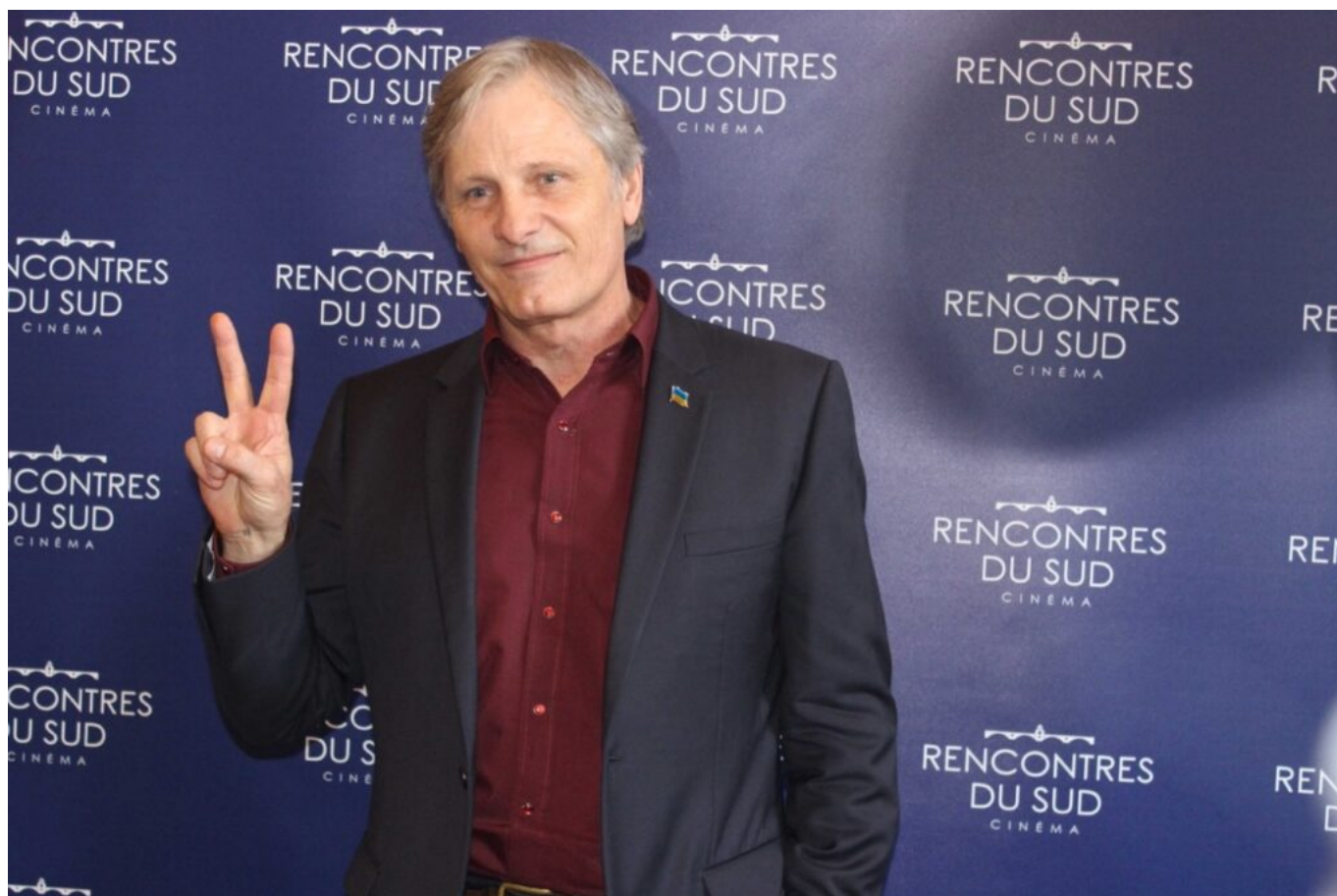
Viggo Mortensen.

Les êtres humains sont capables de faire beaucoup de mal. Il faut éduquer chaque génération et c'est ce que ce père va faire avec ce petit garçon. On vit dans l'espoir », conclut l'humaniste et citoyen du monde qui parle français. Un western aux sensations fortes et un drame romantique.