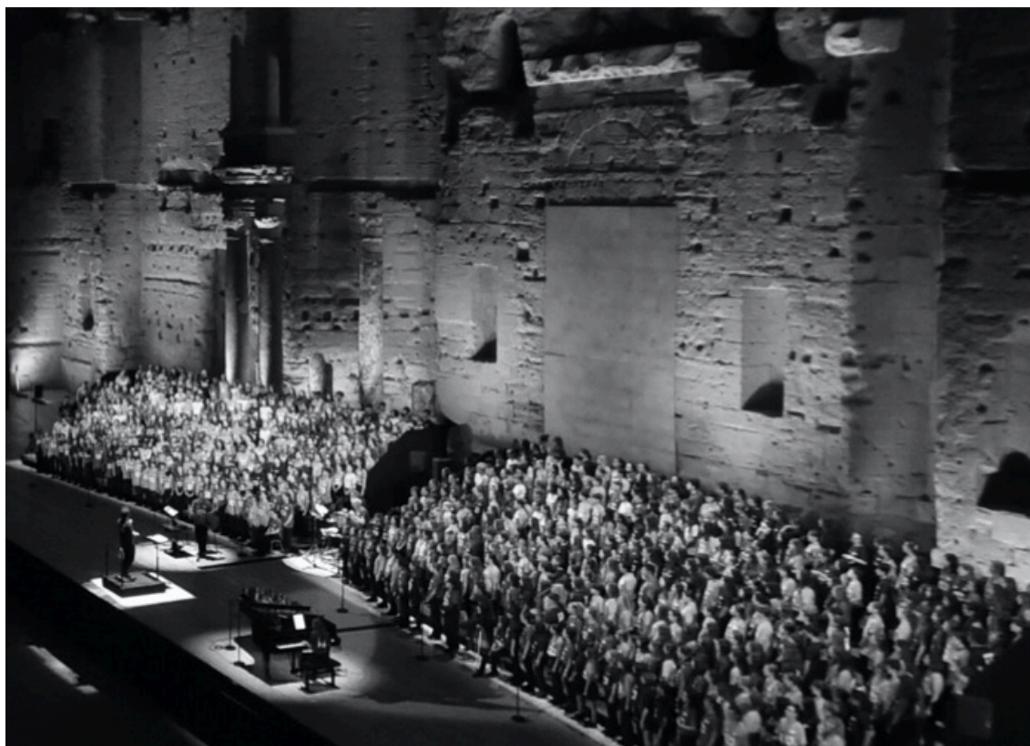
Pop the Opera.

Et il égrène la saison 2025 qui débutera par 'Pop the Opera' le 13 juin, auquel participeront près de 900 jeunes vauclusiens et cette année au chant s'ajoutera de la danse. 'Musiques en Fête' en direct sur France TV sera proposé autour du 21 juin « C'est le 1 er programme culturel du service public qui fasse un audimat aussi élevé en prime time », commente-t-il.