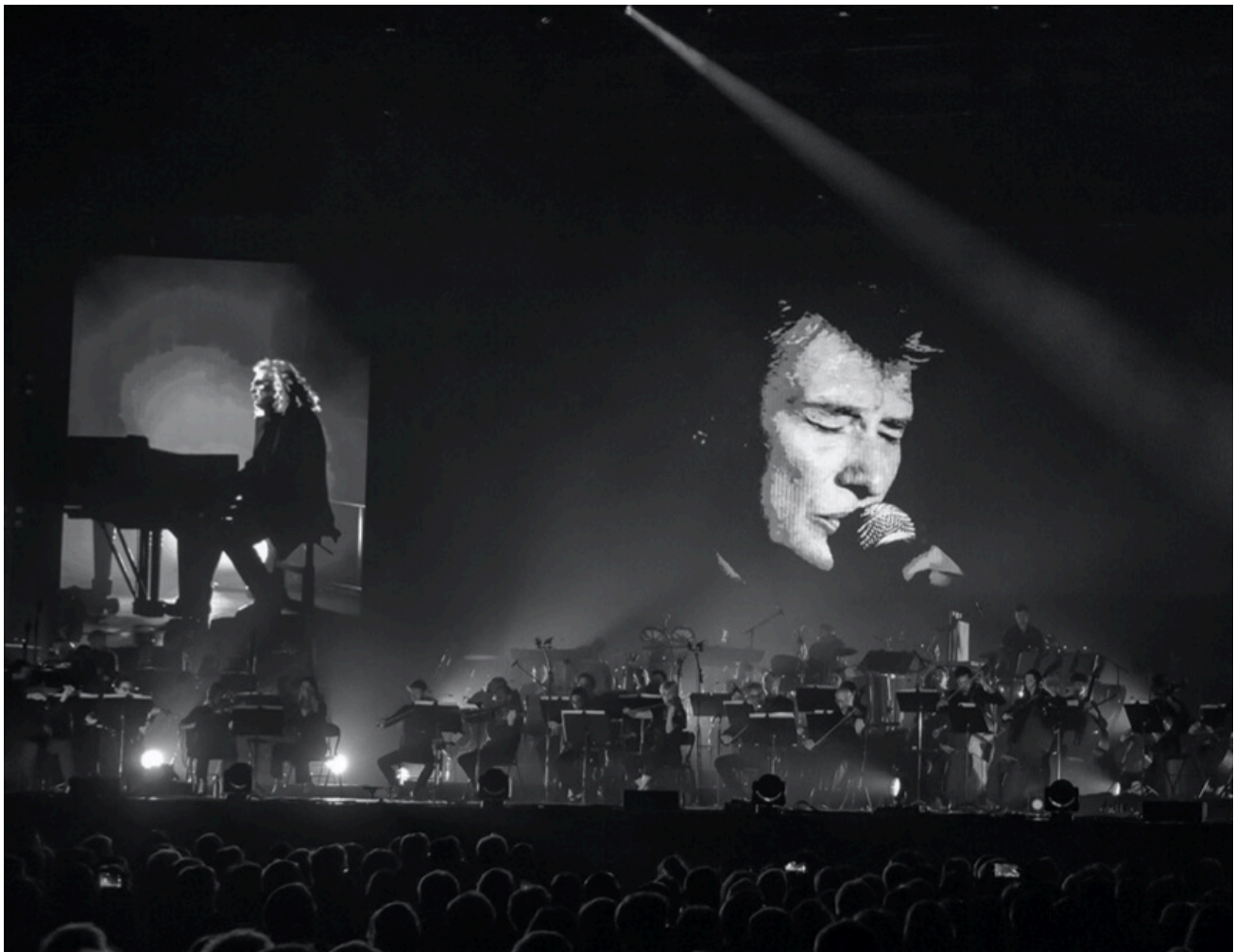
Johnny Symphonique.