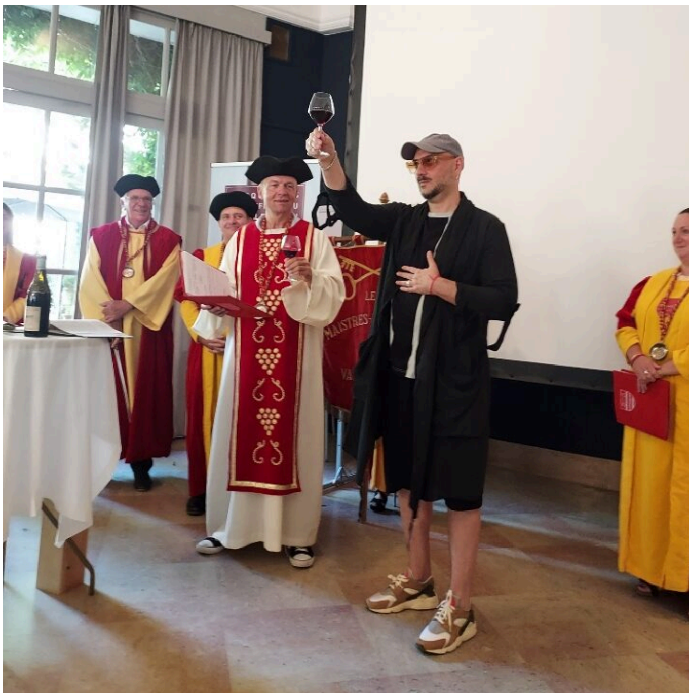
Kirill Serebrennikov et la Confrérie des Maîtres Vignerons de Vacqueyras.

Ces derniers ont ensuite révélé les gagnants dont les vins seront servis aux artistes, metteurs en scène, musiciens, danseurs et chanteurs invités du Festival d'Avignon 2022. Une cinquantaine de caves étaient en lice. Au terme d'une dégustation à l'aveugle, le jury composé de sommeliers et vignerons, a sélectionné des cuvées pour les trois couleurs.