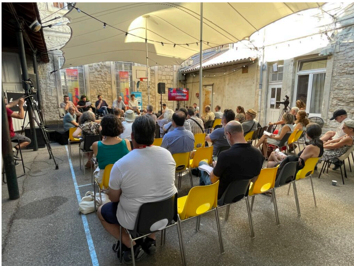
La conférence de presse au Village du off lors du pré-bilan du Festival off d'Avignon