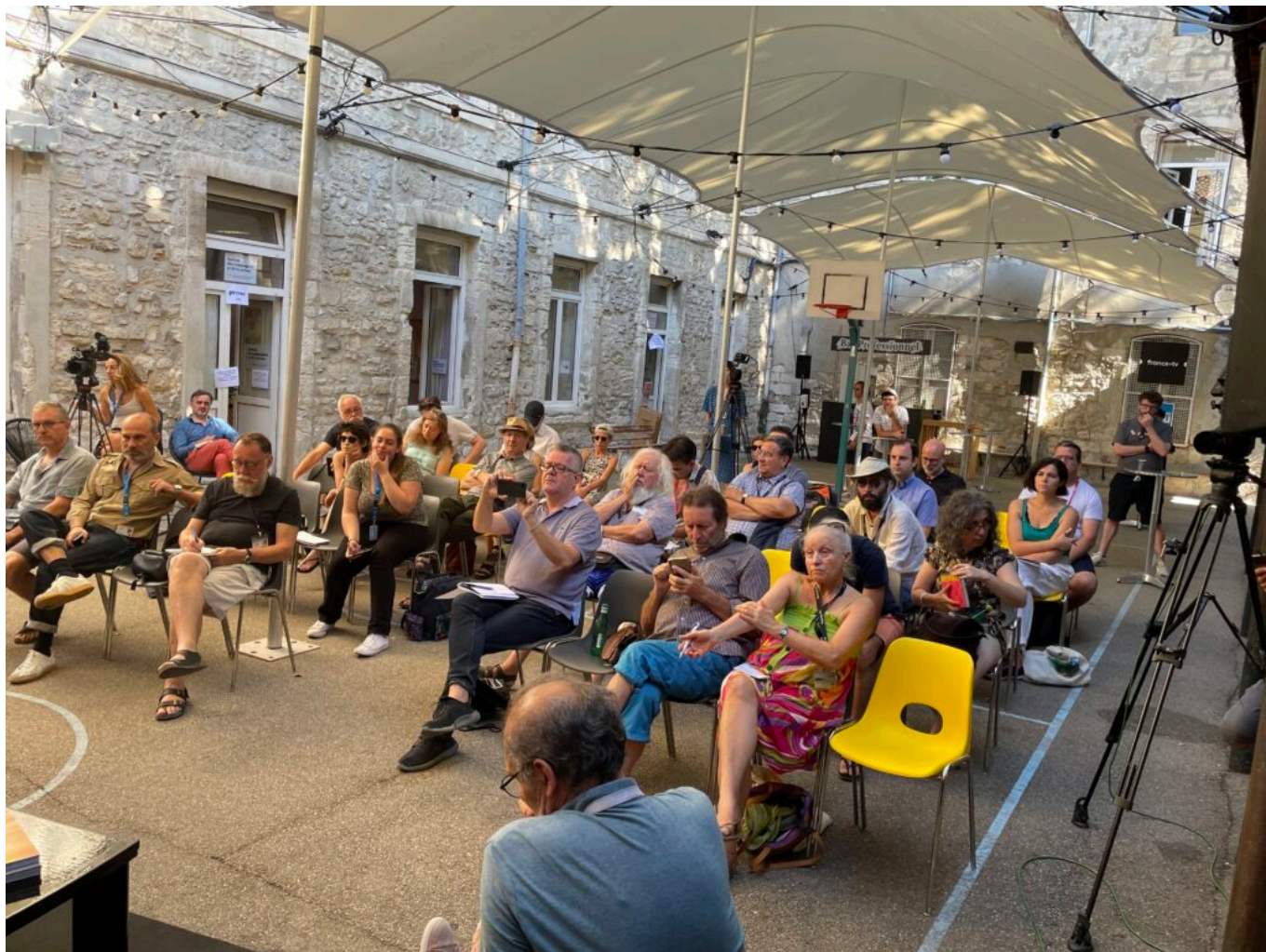
Les journalistes de la conférence de presse