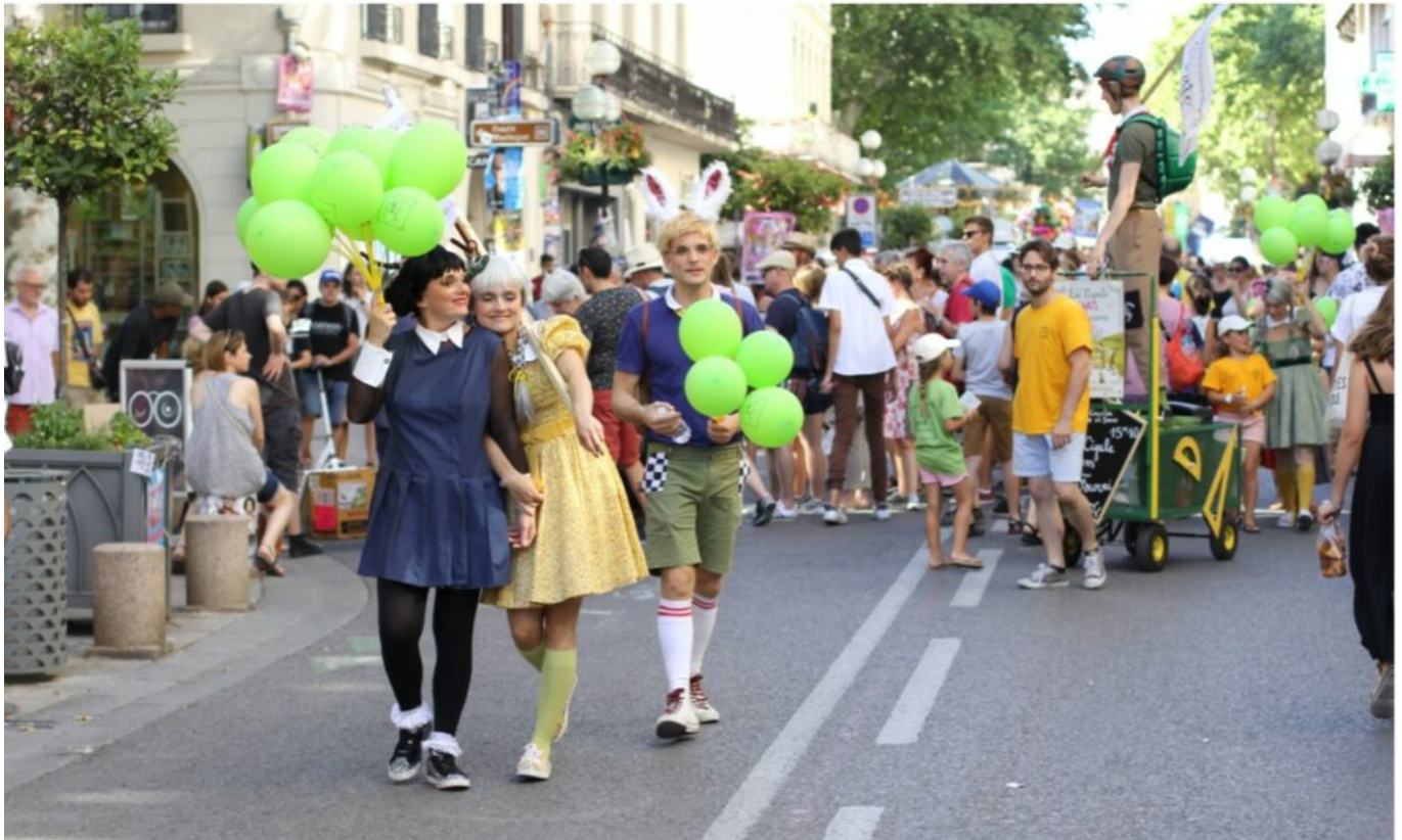
DR Festival Off