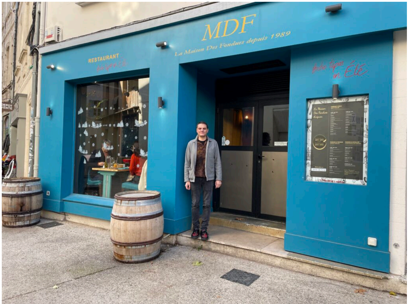
La Maison des fondues