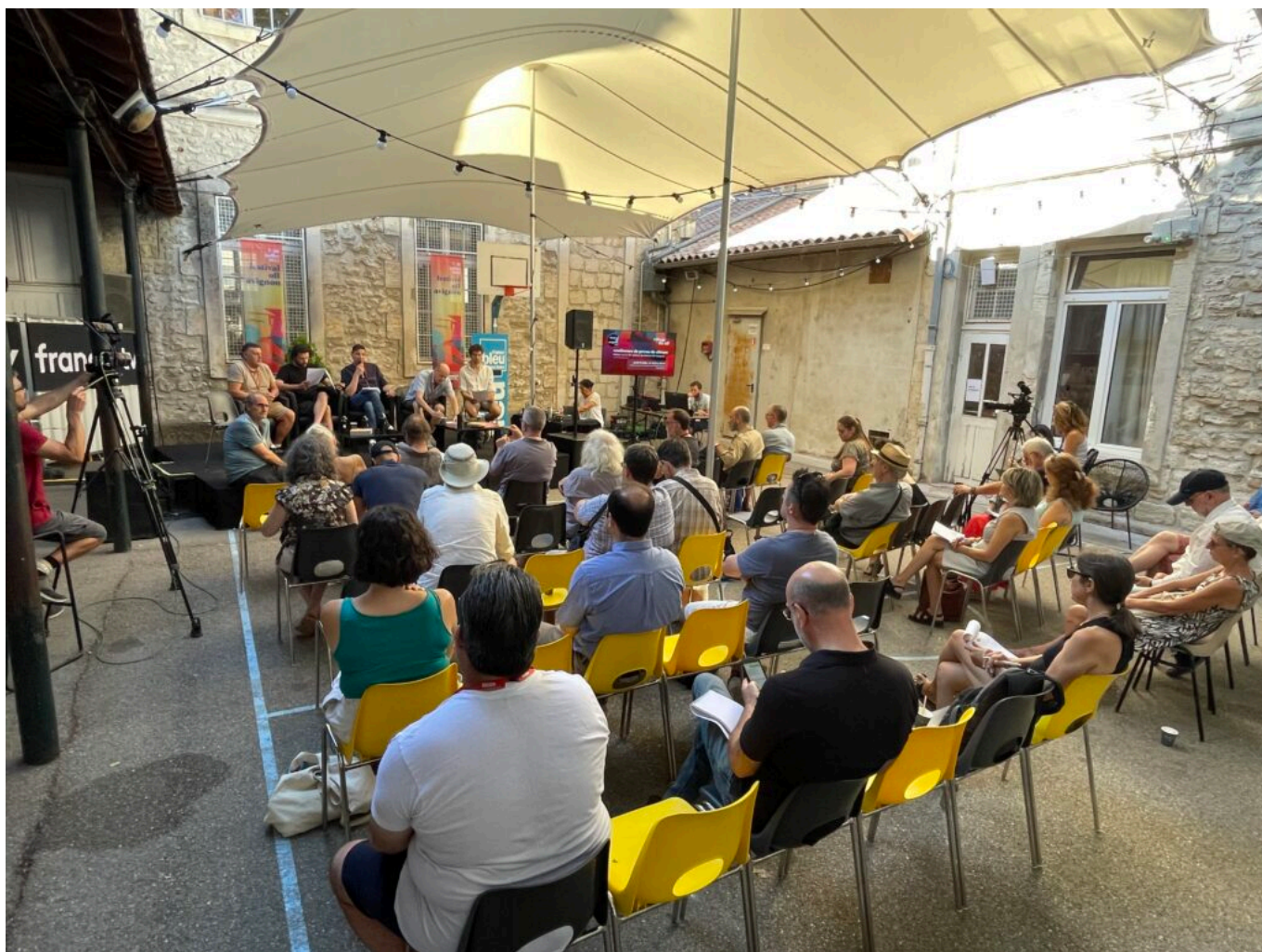
Conférence de presse du pré-bilan du Festival off