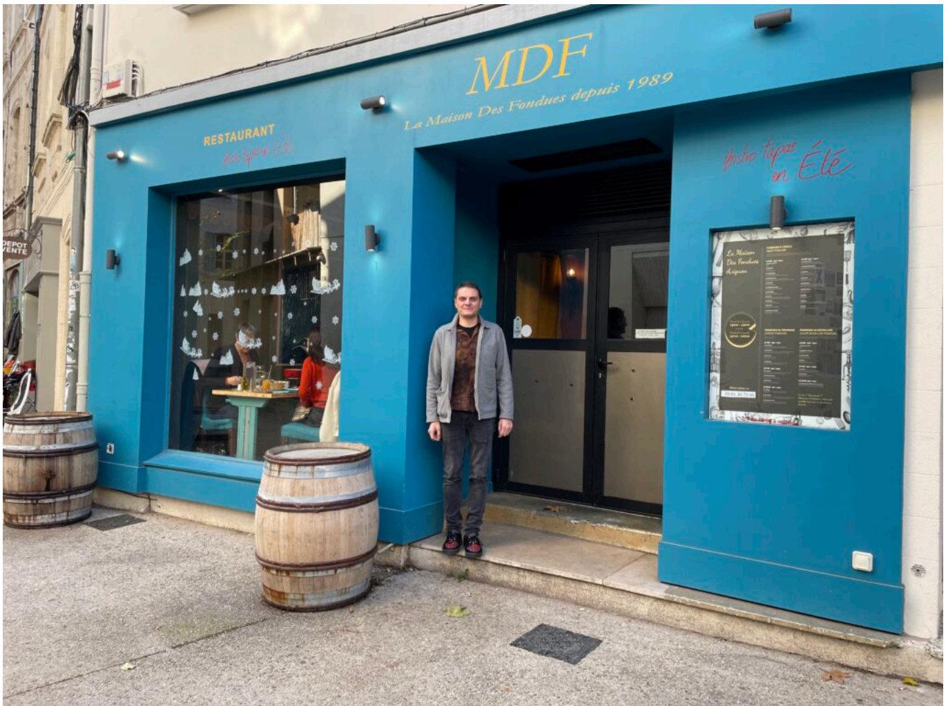
La Maison des fondues