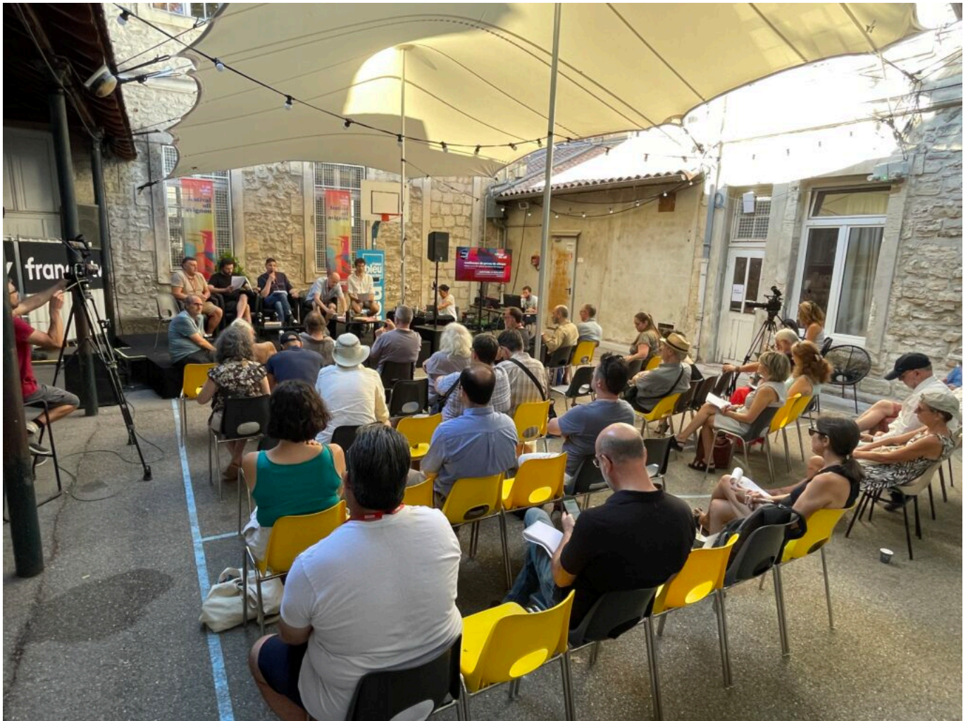
Conférence de presse du pré-bilan du Festival off