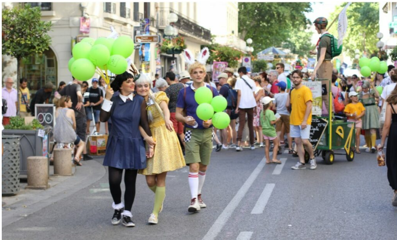
DR Festival Off