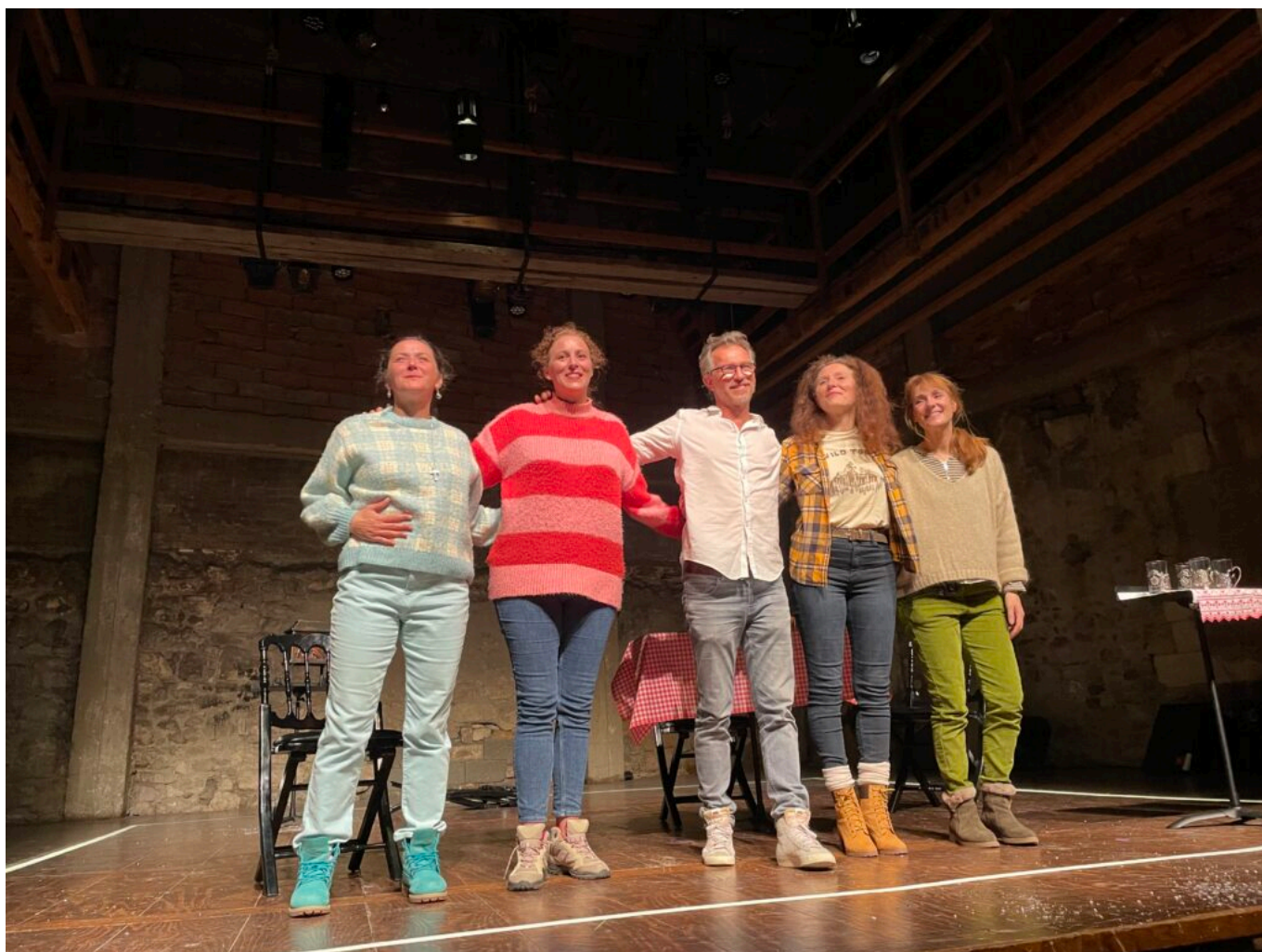
Le metteur en scène entouré des comédiennes