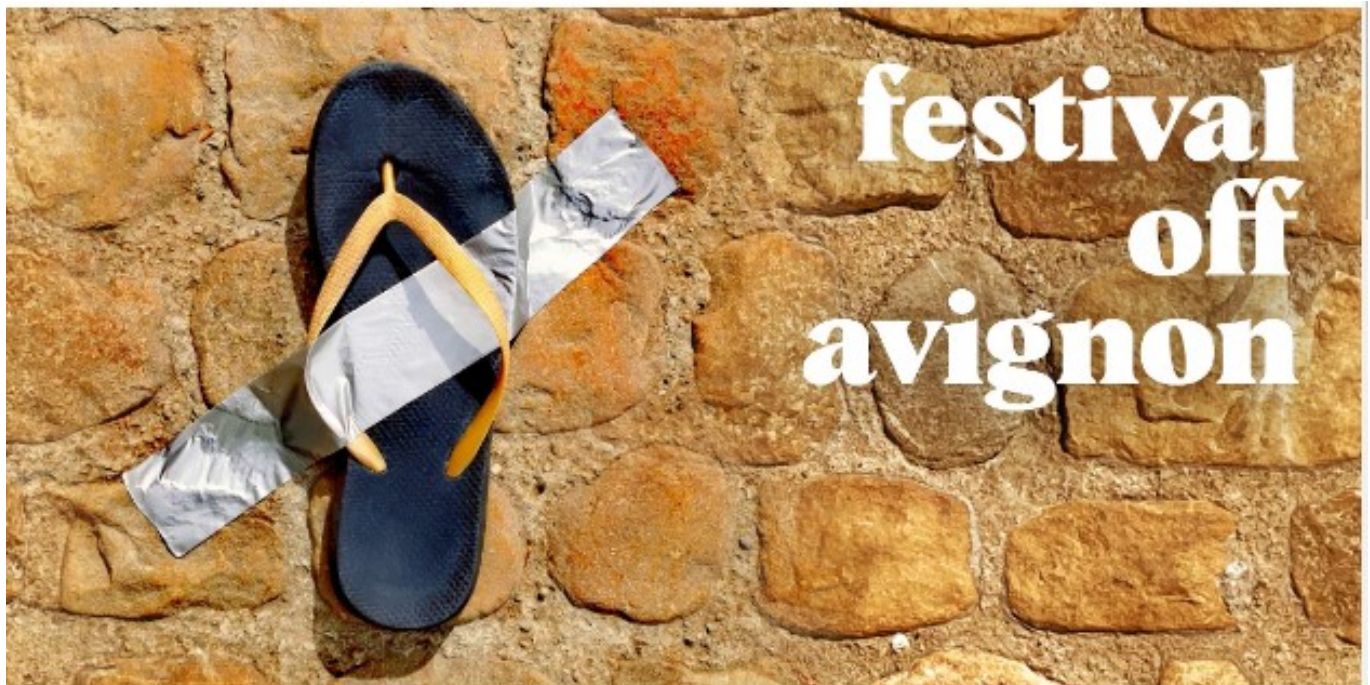
L'affiche du Off

6, rue Pourquery de Boisserin à Avignon, du 7 au 29 juillet, de 9h à 2h du matin.