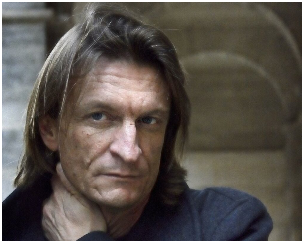
Marcus Malte

Connu et reconnu pour une œuvre récompensée par de nombreux prix littéraires (Garden of love a reçu le Grand Prix des Lectrices Elle catégorie policier en 2007 et le Prix des Lecteurs du Festival du Polar en 2009 ; Le Garçon a reçu le Prix Femina en 2016) Marcus Malte participera à plusieurs tables rondes, disséquera son écriture en compagnie de Hervé Le Tellier ( L'Anomalie, prix Goncourt 2020), participera à une lecture musicale qu'il a initié avec 6 auteurs et autrices, accompagnés par Lo Trio, inspirera un escape game librement adapté de son dernier roman paru en 2022 « Qui se souviendra de Phily-Jo ? »