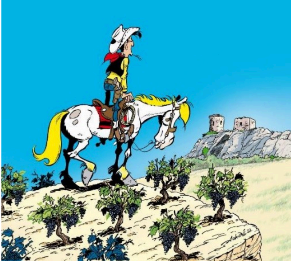
Le dessin de l'affiche de l'événement. ©ACHDÉ