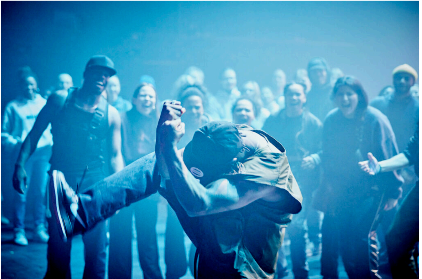
Groove spectacle d'ouverture