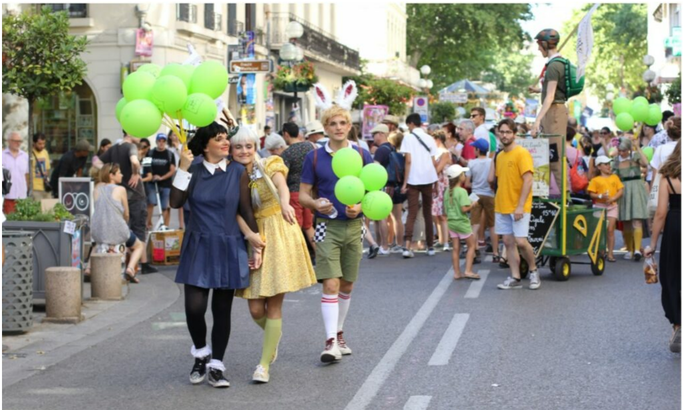
DR Festival Off