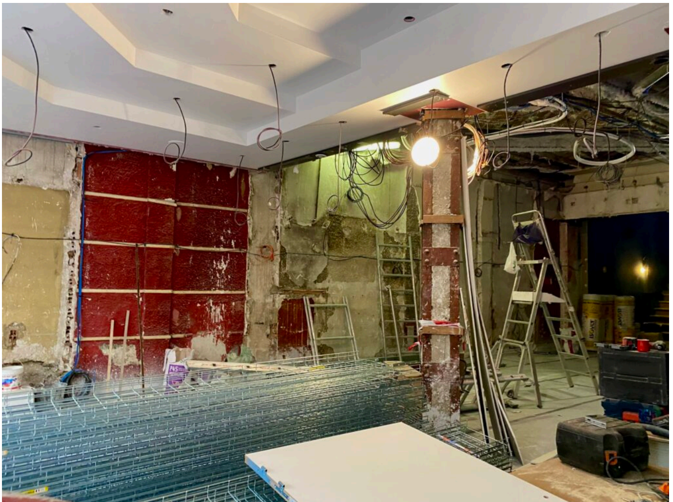
L'entrée de la Scala Provence.

Les propriétaires, qui avaient prévu un coût total de 1,5 millions d'euros pour ces rénovations, ont en fait dû augmenter leur budget. Ce dernier s'élève à plus que le double de ce qui était initialement prévu puisque les travaux vont finalement coûter 3,7 millions d'euros. Mélanie et Frédéric Biessy garantissent que le théâtre sera prêt avant le lancement du Festival Off d'Avignon. Les murs et plafonds de la Scala seront repeints de la teinte de bleu éponyme, les fauteuils, également bleus, seront prêts à accueillir les spectateurs, et les quatre salles de spectacle pourront accueillir les artistes.