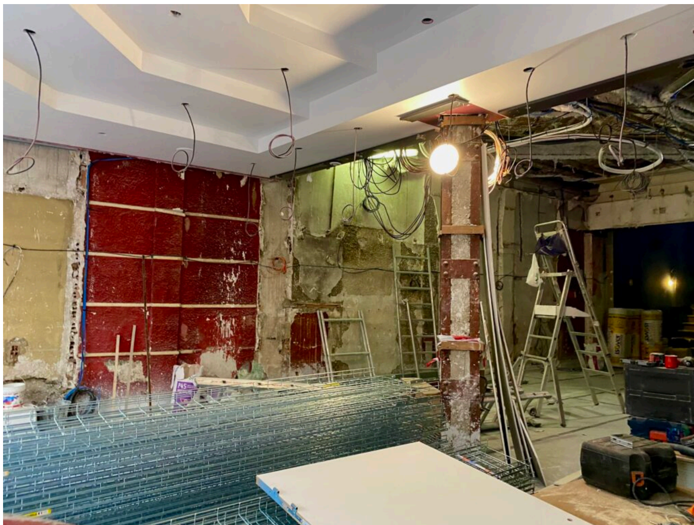
L'entrée de la Scala Provence.

Les propriétaires, qui avaient prévu un coût total de 1,5 millions d'euros pour ces rénovations, ont en fait dû augmenter leur budget. Ce dernier s'élève à plus que le double de ce qui était initialement prévu puisque les travaux vont finalement coûter 3,7 millions d'euros. Mélanie et Frédéric Biessy garantissent que le théâtre sera prêt avant le lancement du Festival Off d'Avignon. Les murs et plafonds de la Scala seront repeints de la teinte de bleu éponyme, les fauteuils, également bleus, seront prêts à accueillir les spectateurs, et les quatre salles de spectacle pourront accueillir les artistes.