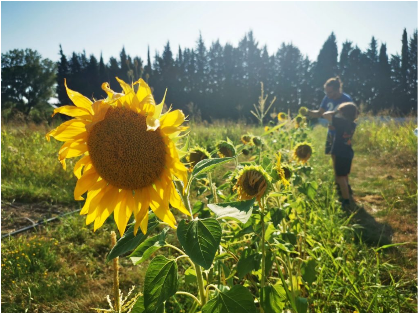
Entre père et fils.

« L'environnement faisait partie de mes préoccupations principales lorsque que j'ai acheté ce terrain. Ma philosophie de vie ? Je ne veux rien coûter à la planète. Je ne souhaite pas prendre plus que ce que l'on me donne », précise le propriétaire. Une balance équilibrée, des comptes à zéro et aucun remord vis-à-vis de mère nature. Alors même si l'étau se resserre et que l'humanité court gentiment à la catastrophe, ses idéaux ne changent pas d'un iota.