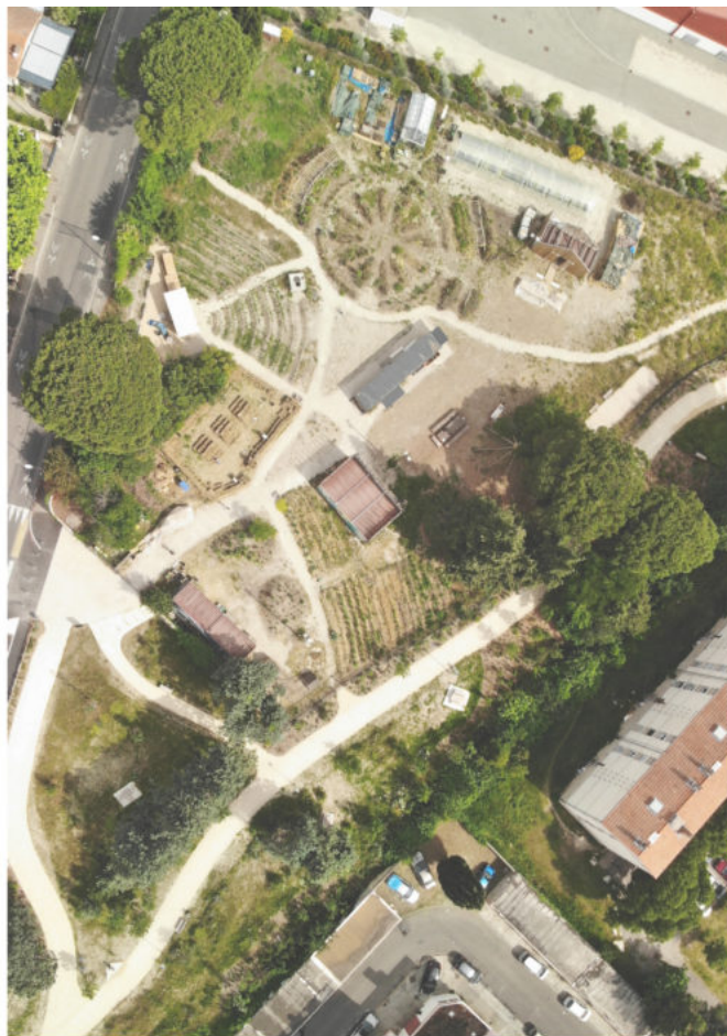
Le site de la ferme urbaine Le Tipi en Juin 2021