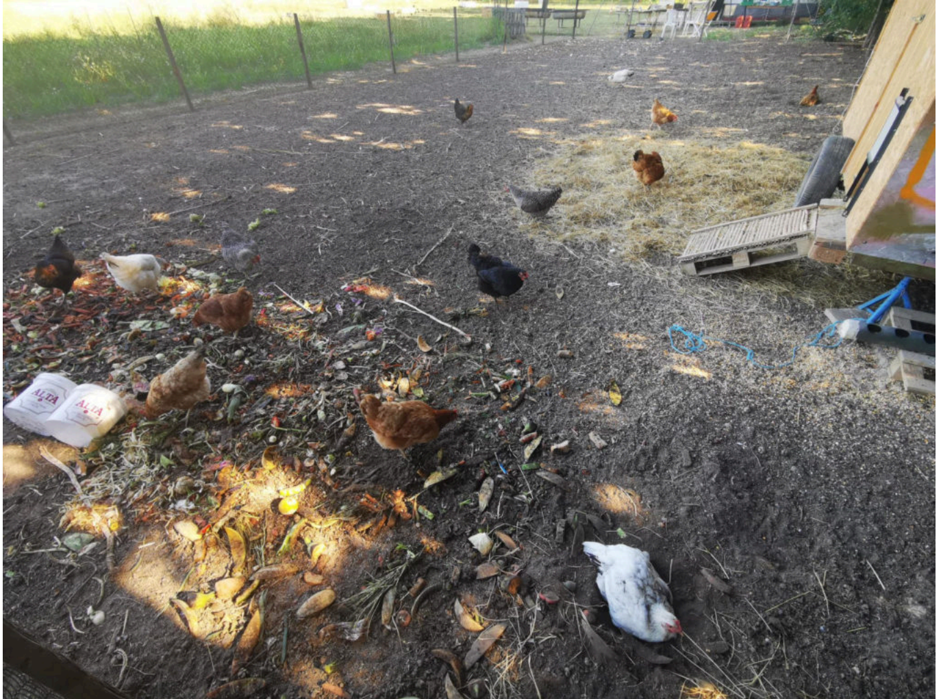
Les stars de la ferme.

remarque le propriétaire. Vous savez désormais ce qu'il vous reste à faire : oubliez le papier vert.