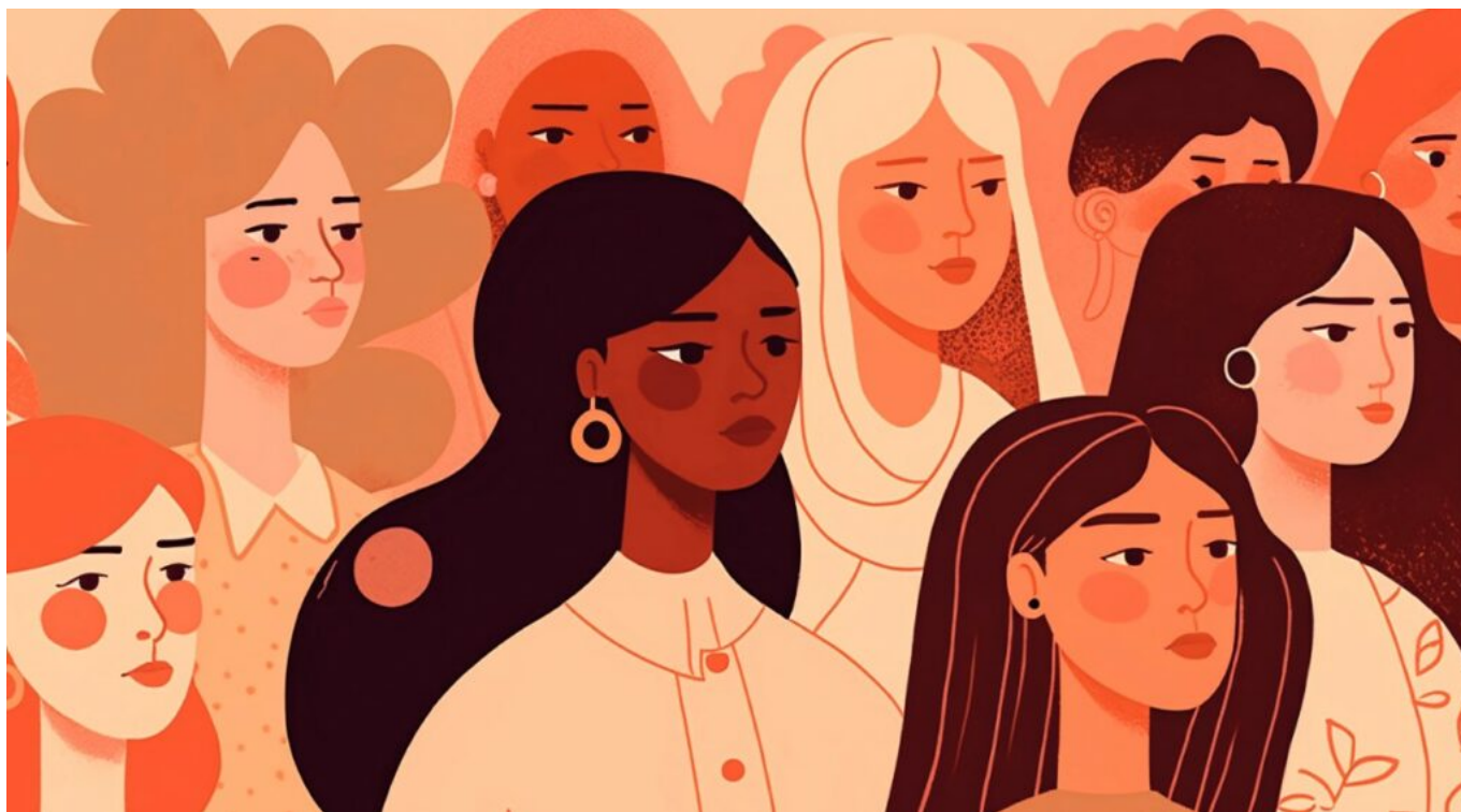
Table ronde sur le droit des femmes à disposer de leur corps

À l'occasion de la Journée internationale des droits des femmes, le CER (Centre d'enseignement et de recherche) Droit d' Avignon université et le Barreau d'Avignon organisent une table ronde sur le droit des femmes à maîtriser leur corps. Cinquante ans après la loi Veil et un an après l'entrée dans la Constitution