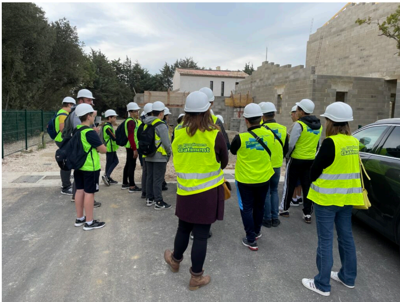
Les coulisses du bâtiment

veut dire que le jeune qui veut construire ne le peut plus, et le cadre moyen se retrouve primo accédant, et là, nous créons une tension sociale. D'autant plus qu'il n'y a plus de logements sociaux qui, au départ, existaient pour aider les gens à se lancer dans la vie, à travailler, puis à aller vers l'accession, ou encore aider les gens en difficulté. Sauf qu'aujourd'hui, le volet des gens en difficulté inclut les jeunes et les travailleurs actifs. Lorsque l'on travaille, on ne devrait pas être en difficulté or, aujourd'hui c'est le cas ! Un couple avec un enfant et un salaire correct chacun se retrouve en difficulté parce qu'il ne peut plus aller vers l'accession. Le problème est devenu profond.»